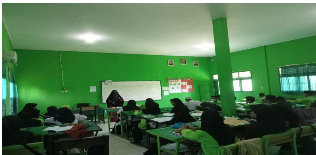
Observasi Pembelajaran PAI di kelas