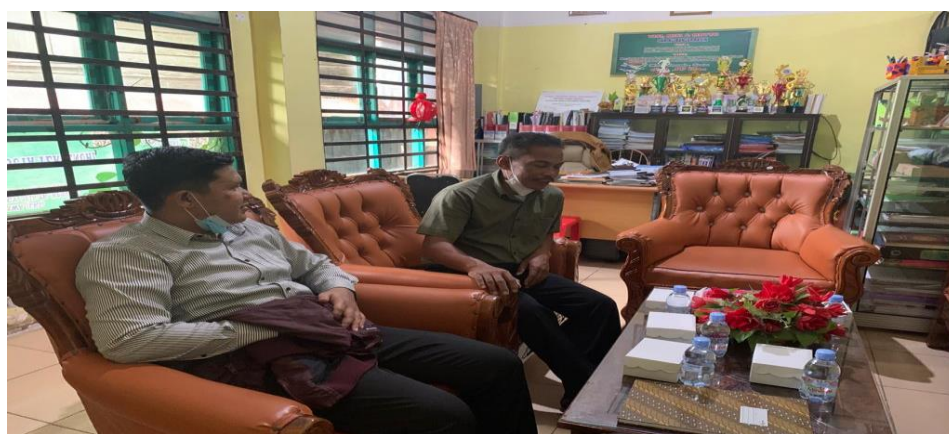
Bersama Kepala SMK NU Banjarmasin