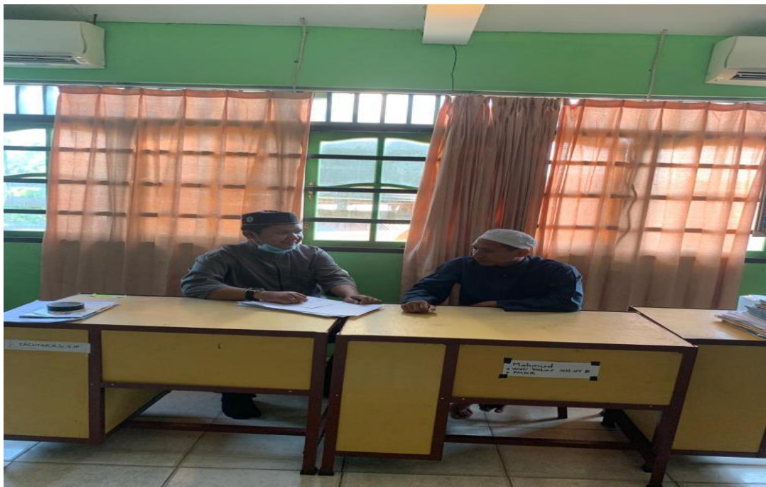
Bersama Guru PAI SMK NU Banjarmasin