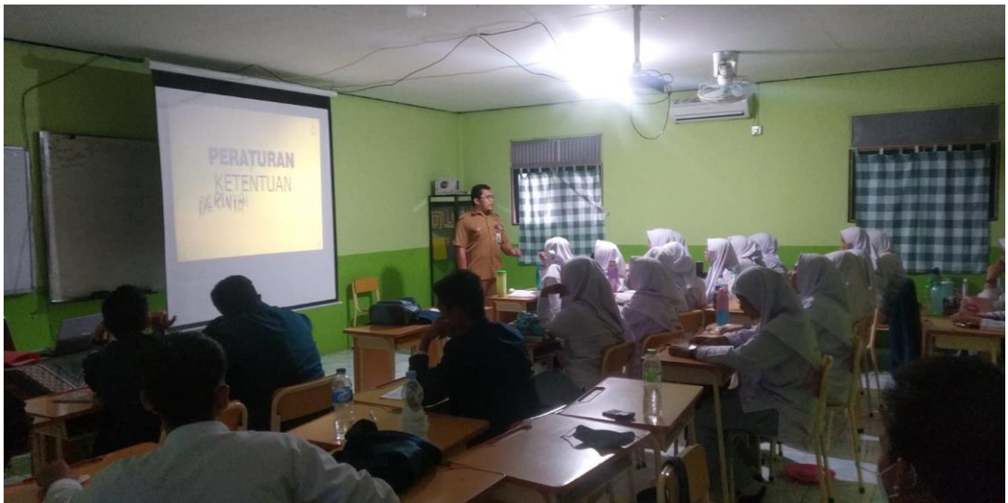
Observasi Pembelajaran PAI di kelas