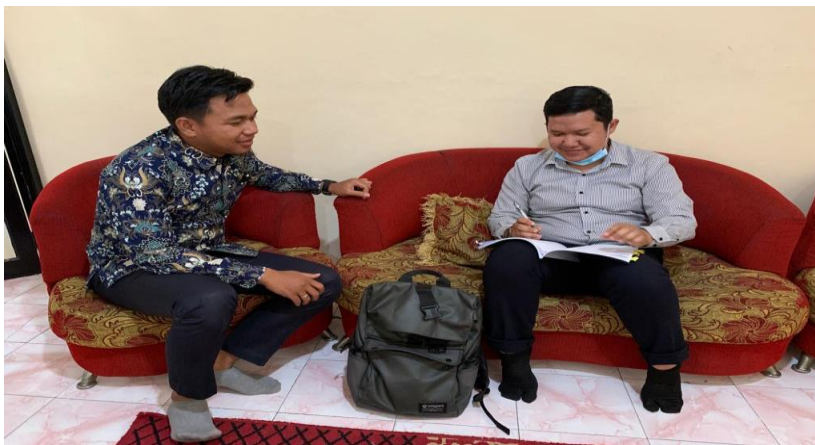
Bersama Kepala SMK Farmasi Al Furqon Banjarmasin