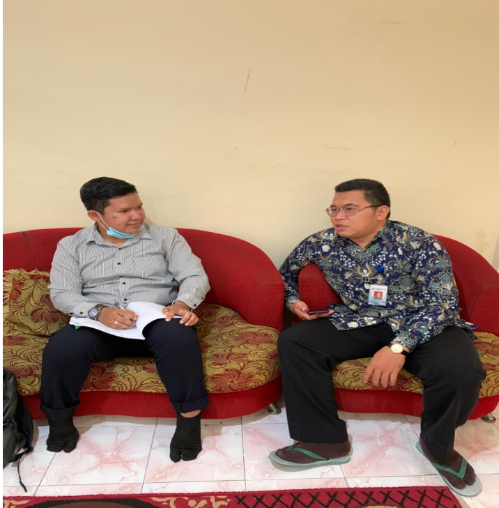
Bersama Guru PAI SMK Farmasi Al Furqon Banjarmasin