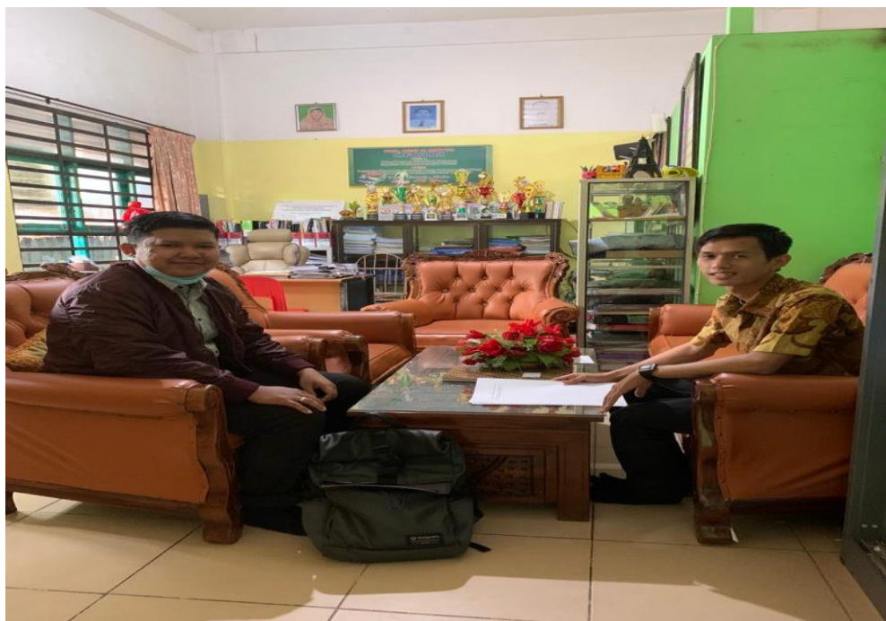
Menyerahkan Surat Riset