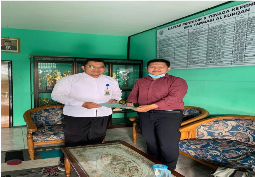
Menyerahkan Surat Riset ke SMK Farmasi Al Furqon Banjarmasin