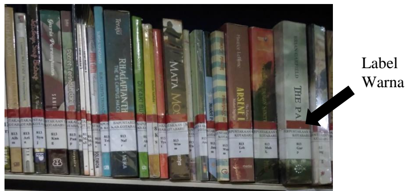
Gambar 4.1 Buku dengan label warna

kesalahan pada buku yang salah tempatnya, mereka juga sangat cepat menyelesaikan penyusunan buku ke rak ( shelving ).