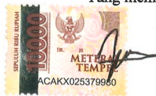
Imam Al Hakam