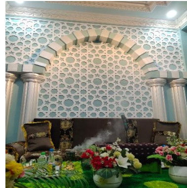
Foto Bangunan Majelis Taklim Raudhatussyifa Wal Fataya