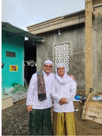
Foto Bersama Khadim Majelis Taklim Raudhatussyifa Wal Fataya