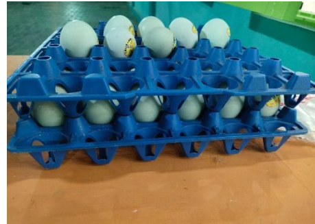
Foto Usaha Majelis Taklim Raudhatussyifa Wal Fataya (Café Fata Dan Telur Zen Ahbab)