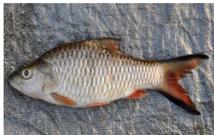
Gambar 4.5b Literatur Ikan Jelawat

Berdasarkan hasil pengamatan, ikan Leptobarbus hoevani yang dikenal dengan nama daerah ikan jelawat. Ikan ini memiliki panjang keseluruhan sekitar \pm 18 cm, panjang baku 14 cm dan tinggi 4,5 cm. Memiliki bentuk tubuh yang pipih dan memanjang, dengan warna sisik putih kekuningan pada bagian badannya, warna hitam kecoklatan pada bagian punggungnya dan warna kemerahan pada bagian sirip perut, sirip ekor, dan sirip duburnya.