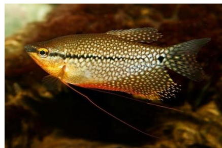
Gambar 4.11b Literatur Ikan Sapat Layang