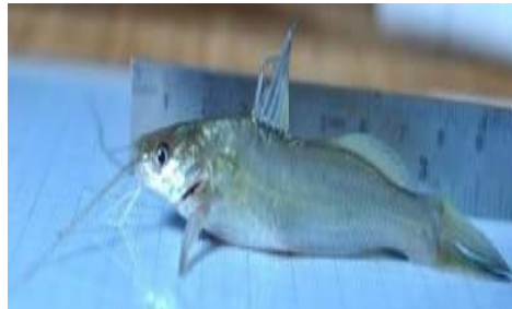
Gambar 4.4b Literatur Ikan Sanggiringan

Berdasarkan hasil pengamatan, ikan Macroness nigriceps dikenal dengan nama daerah ikan sanggiringan. Ikan yang memiliki panjang keseluruhan \pm 17 cm, panjang baku 14 cm dan tinggi 2,1 cm. Memiliki bentuk tubuh agak bulat pada bagian perutnya, bagian punggungnya berwarna hijau keabu-abuan dan warna putih pada bagian perutnya. Bentuk tubuh ikan ini memiliki banyak kemiripan dengan ikan lundu, baik dari bentuk tubuh, warna tubuh maupun sungut dan pantil. Hal ini dikarenakan ikan ini tergolong satu keluarga dengan ikan lundu.