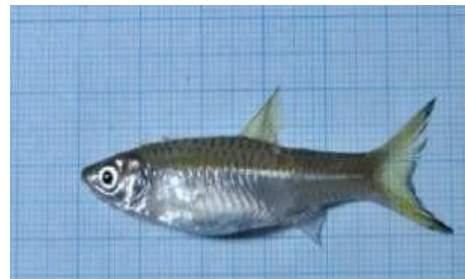
Gambar 4.6b Literatur Ikan Saluang

Berdasarkan hasil pengamatan, ikan Rasbora aurotaenia yang dikenal dengan nama daerah ikan saluang batang. Ikan ini memiliki panjang keseluruhan +- 7,5 cm, panjang baku 6,5 cm dan