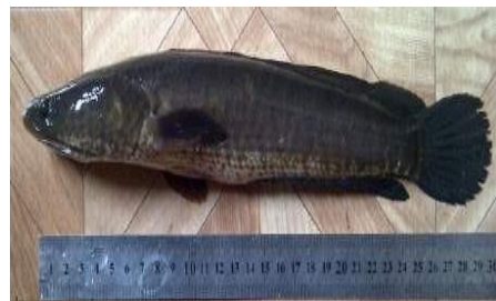
Gambar 4.8b Literatur Ikan Gabus

Berdasarkan hasil pengamatan, ikan Ophiocephalus striatus yang dikenal dengan nama lokal ikan gabus dan nama daerah ikan haruan, memiliki panjang keseluruhan sekitar 20 cm, panjang baku 18 cm dan tinggi 3 cm. Memiliki bentuk tubuh yang mirip dengan ikan kihung karena tergolong satu keluarga. Perbedaannya terletak pada bentuk kepala serta corak warna sisik pada badannya. Memiliki warna sisik putih kecoklatan pada bagian perut, warna