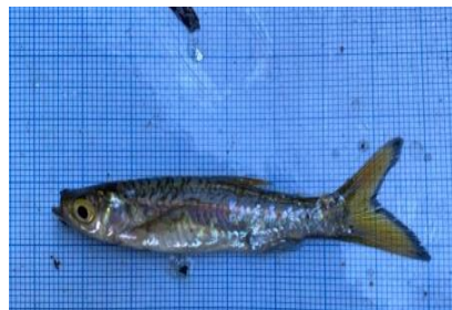
Gambar 4.6a Ikan Saluang