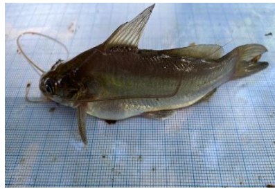
Gambar 4.3a Ikan Lundu