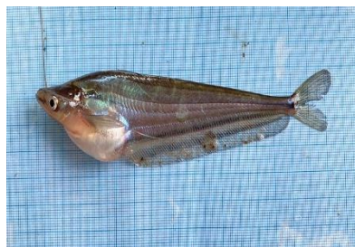
Gambar 4.7a Ikan Lais (Sumber: Dokumentasi Pribadi, 2022)