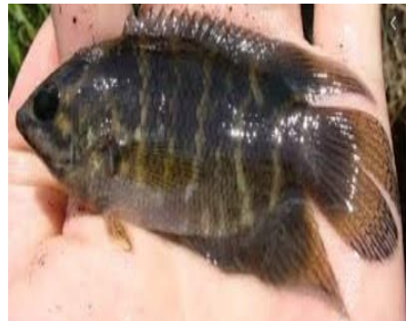
Gambar 4.2a Ikan Kakapar Gambar 4.2b Literatur Ikan Kakapar

Berdasarkan hasil pengamatan, ikan Belontia hasselti dikenal dengan nama daerah ikan kakapar. Ikan ini memiliki panjang keseluruhan \pm 9 cm, panjang baku 7 cm dan tinggi 4,2 cm. Memiliki bentuk tubuh agak bulat namun memipih ke bagian belakang. Berwarna hitam ketika baru diangkat, semakin lama didaratan semakin muncul garis-garis terang berwarna kekuningan. Bagian punggung ikan berwarna hitam mengkilat.