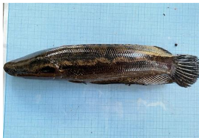
Gambar 4.9a Ikan Kihung