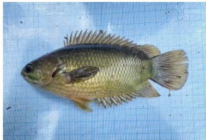
Gambar 4.10a Ikan Papuyu