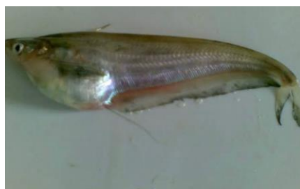
Gambar 4.7b Literatur Ikan Lais (Docplayer., 2022)

Berdasarkan hasil pengamatan, ikan Cryptopterus hexapterus yang dikenal dengan nama daerah ikan lais. Ikan ini memiliki panjang keseluruhan \pm 16,5 cm, panjang baku 14,5 cm dan tinggi 3,5 cm. Memiliki bentuk tubuh pipih dan memanjang. Jenis ikan yang tidak mempunyai sisik namun ikan ini memiliki sungut yang berfungsi sebagai sensor untuk mencari makanan. Ikan yang memiliki warna putih mengkilat pada bagian perut, putih abu-abu pada bagian badan dan abu-abu pada bagian punggungnya. Ikan lais memiliki banyak sekali jenis. Pada jenis ini bentuk perut dari ikan lais menggelembung dan bulat dengan bagian punggung yang sedikit membungkuk.