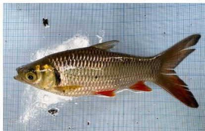
Gambar 4.5a Ikan Jelawat