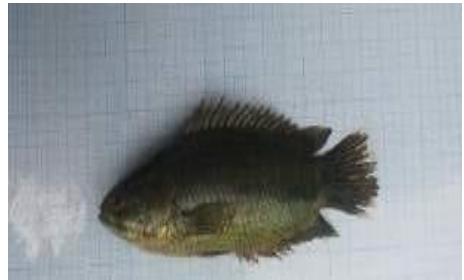
Gambar 4.10b Literatur Ikan Papuyu

Berdasarkan hasil pengamatan, ikan Anabas testudineu dikenal dengan nama lokal ikan betok dan nama daerah ikan papuyu, memiliki panjang keseluruhan +16 cm, panjang baku 14 cm dan tinggi 5 cm. Memiliki warna sisik hitam pada bagian punggungnya, hitam kemerahan pada bagian perutnya dan hitam kehijauan pada bagian badannya. Ikan jenis ini banyak memiliki duri (sirip keras) pada bagian punggungnya. Dimana sirip tersebut seringkali dijadikan sebagai perlindungan dari ancaman musuh.