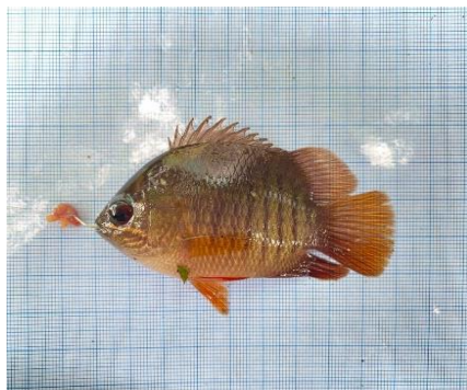
Gambar 4.1a Ikan Patung