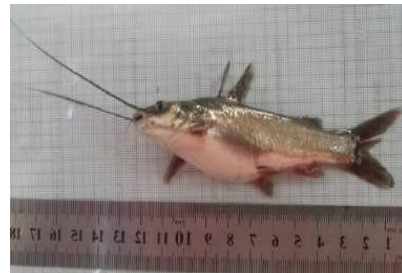
Gambar 4.3b Literatur Ikan Lundu

Berdasarkan hasil pengamatan, ikan Macroness gulio dikenal dengan nama daerah ikan lundu. Ikan ini memiliki panjang keseluruhan \pm 10 cm, panjang baku 8,5 cm dan tinggi 3 cm. Memiliki bentuk tubuh yang agak bulat pada bagian perutnya, memiliki warna abu-abu hitam pada bagian punggungnya dan putih mengkilat pada bagian perutnya. Ikan jenis ini memiliki sungut yang berfungsi sebagai sensor untuk mencari makanan. Ikan ini juga