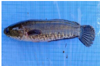
Gambar 4.8a Ikan Gabus