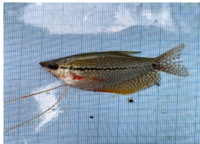
Gambar 4.11a Ikan Sapat Layang