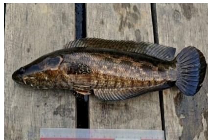
Gambar 4.9b Literatur Ikan Kihung

Berdasarkan hasil pengamatan, ikan Ophiocephalus lucius dikenal dengan nama daerah ikan kihung, memiliki panjang keseluruhan sekitar \pm 30 cm, panjang baku 28 cm dan tinggi 4,5 cm. memiliki bentuk tubuh yang sangat mirip dengan ikan gabus karena tergolong dalam satu keluarga. Bedanya hanya pada bagian kepala dan corak badannya. Ikan kihung memiliki sisik badan yang unik, pada bagian punggung dan perut berwarna hitam sedangkan pada bagian tengah badannya berwarna hitam dengan corak kecoklatan.