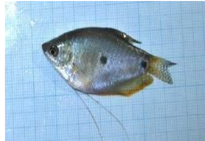
Gambar 4.12b Literatur Ikan Sapat Nagara

Berdasarkan hasil pengamatan, ikan Trichogaster trichopterus dikenal dengan nama daerah ikan sapat nagara, memiliki panjang keseluruhan \pm 8 cm, panjang baku 7 cm dan tinggi 3 cm. Memiliki bentuk tubuh pipih dengan bintik berwarna gelap pada tengah badannya yang menjadi ciri khas dari ikan jenis ini. Memiliki sisik berwarna merah kehitaman pada bagian punggungnya, putih perak bagian perutnya serta abu-abu kekuningan pada bagian perutnya. Djuhanda (1981) ikan jenis ini memiliki panjang baku berkisar antara 6-10 cm dengan tinggi \pm 3,5 cm dan panjang keseluruhan menurut Peters (1852) dengan kisaran 5,8-6,6 cm. Menurut Destiara (2018) ikan jenis ini memiliki warna merah kehitaman pada bagian punggungnya, putih mengkilat seperti