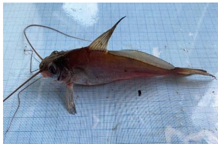
Gambar 4.4a Ikan Sanggiringan