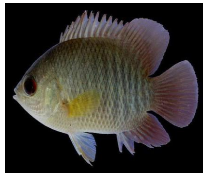
Gambar 4.1b Literatur Ikan Patung