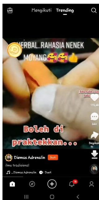
Gambar 4.2 Tampilan Aktivitas dari Menonton Video