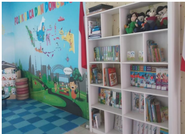
CDF01.9. Gambar Ruang Perpustakaan KB & TK Islamic Center Kota Samarinda