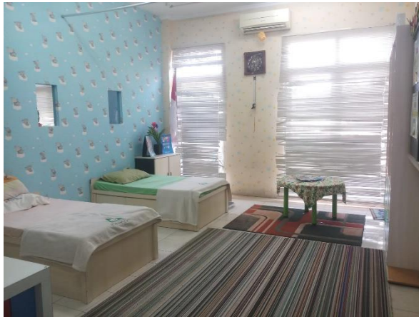
CDF01.11. Gambar Ruang UKS KB & TK Islamic Center Kota Samarinda