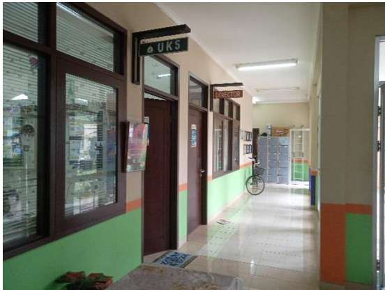
CDF01.4. Gambar Koridor UKS dan Kepala Sekolah KB & TK Islamic Center Kota Samarinda