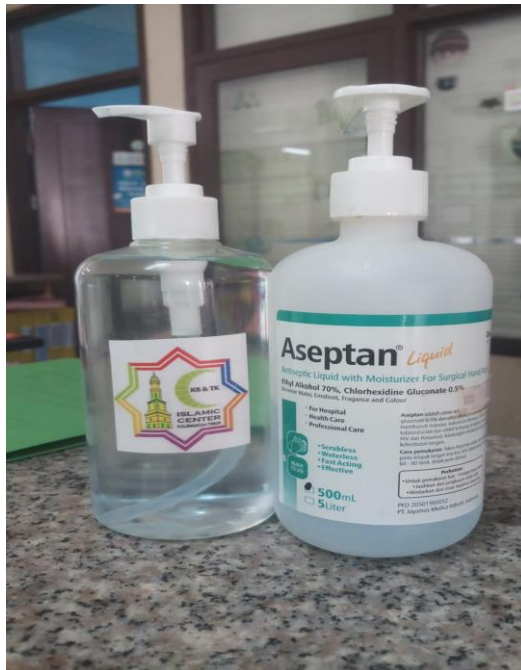
CDF02.4. Gambar Handsinitizer KB & TK Islamic Center Kota Samarinda