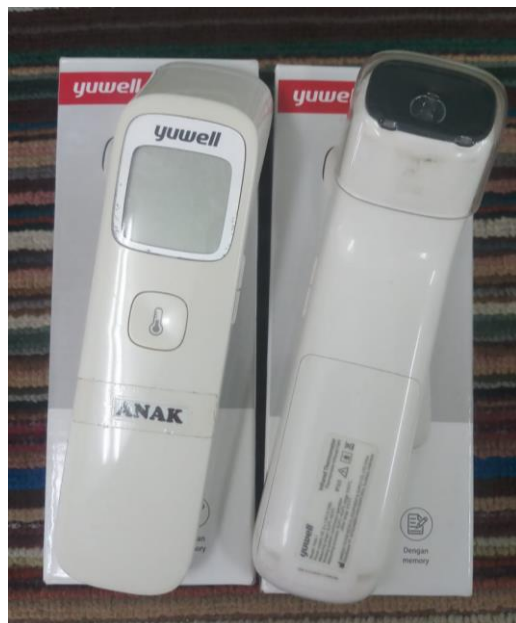
CDF02.5. Gambar Thermogun KB & TK Islamic Center Kota Samarinda