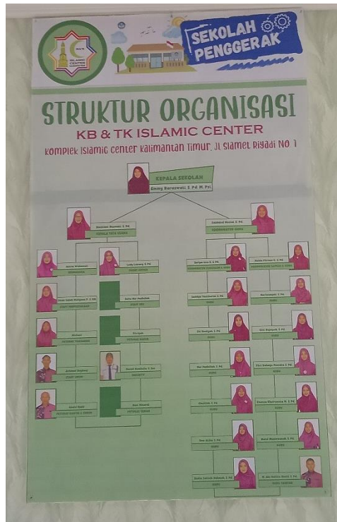
CDF01.8. Gambar Struktur Organisasi KB & TK Islamic Center Kota Samarinda