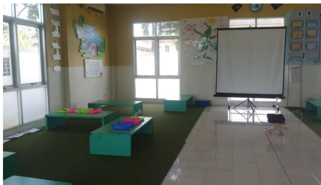
CDF01.10. Gambar Ruang Keislaman KB & TK Islamic Center Kota Samarinda