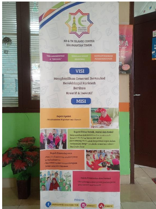
CDF01.8. Gambar Visi Misi KB & TK Islamic Center Kota Samarinda