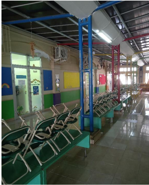
CDF01.8. Gambar Koridor Ruang Kelas KB & TK Islamic Center Kota Samarinda