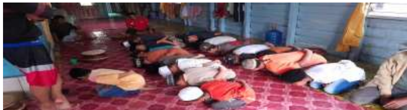
Gambar 4.4 Pola Gerakan Temudung Bunga Trim