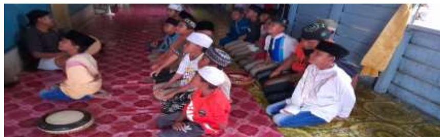
Gambar 4.3 Pola Gerakan Posisi Temudung

Pola Gerakan Posisi Temudung adalah pola perudot dalam posisi duduk. Temudung dalam Bahasa Suku Tidung artinya adalah duduk. Namun duduk yang dimaksudkan disini adalah duduk