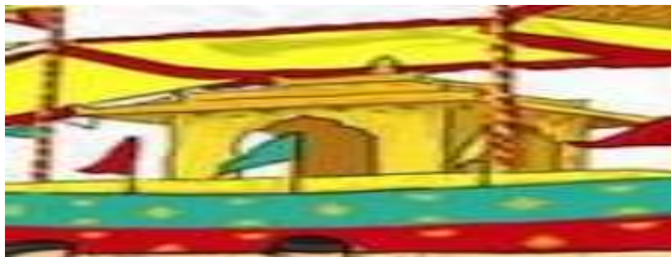
Gambar 4.11 Ilustrasi Meligay atau tempat sesajennya Suku Tidung

tampi atau nampun yang terbuat dari tembaga berwarna kuning. Kemudian bambu yang telah diraut lalu diberikan kain yang berukiran Naga atau Busak saray , lalu pada ujung bambu tersebut diberikan daun pandan yang telah dipotong kecil-kecil dan disimpan pada ujung bambu tersebut. Kemudian kain berwarna kuning dan Hitam yang dibentuk sedemikian rupa. Lalu kemudian, Ayam belungis atau tikar yang telah dianyam oleh masyarakat Suku Tidung. Pada sore hari tersebut dibuatkan juga perlengkapan untuk mengisi Kelanggang atau Meligay , seperti air kopi, gula, ketan berwarna kuning atau dalam Bahasa tidungnya adalah Nasi wasur , lilin dan telur. 148