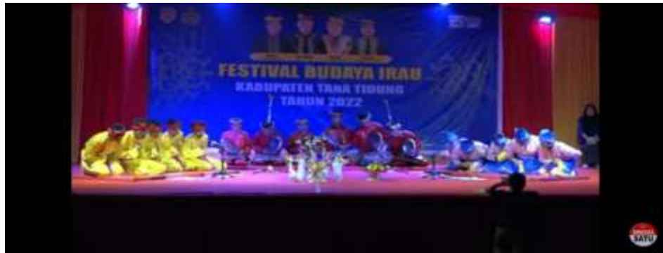
Gambar 4.12 Penampilan Kesenian Rudot beserta alat-alatnya

Dari alat-alat yang digunakan untuk melaksanakan Kesenian rudot pada Masyarakat suku tidung tersebut (telah dijelaskan pada tabel 4.14), kemudian digunakan Kembali sebagai bentuk syarat-syarat untuk melaksanakan Prosesi Gunting Abuk de Anak pada masyarakat Suku Tidung. Adapun akulturasi Kesenian Rudot pada Budaya Masyarakat Suku Tidung yang terdapat pada Pelaksanaan Prosesi Gunting Abuk de Anak adalah sebagai berikut: