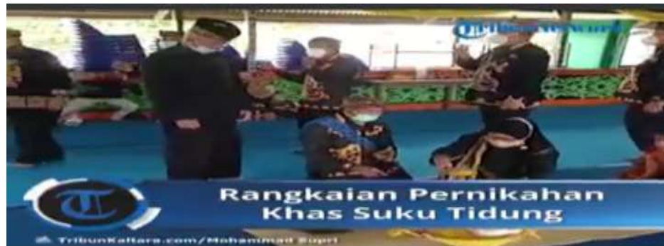
Gambar 4.10 Prosesi bepupur

Prosesi Bepupur adalah Bepupur memiliki arti menaburkan atau mengusapkan pupur racikan yang cair dan wangi khas Tidung kepada kedua mempelai. Acara bepupur ini dilaksanakan dirumah masing-masing akan tetapi jika salah satu dari pihak mempelai berbeda kampung maka akan dilaksanakan secara bersama-sama. 141