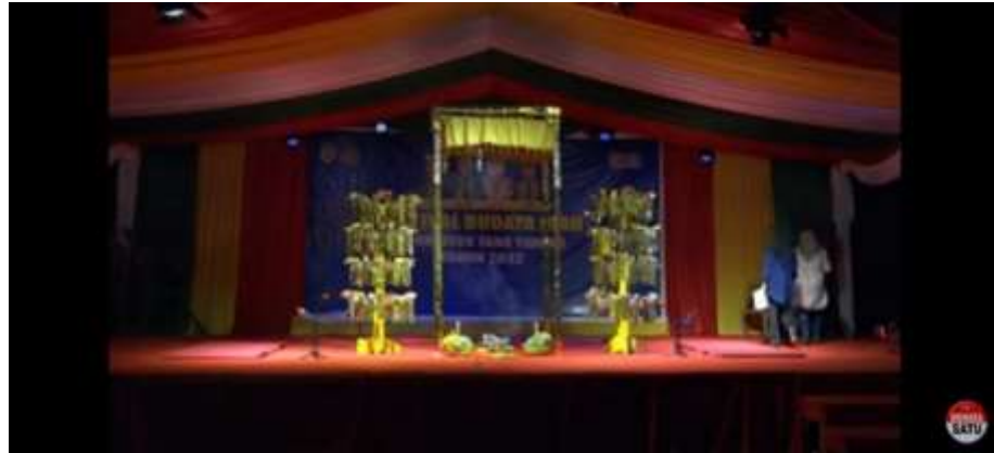
Gambar 4.8 Malay dan seluruh alat-alat Prosesi Gunting Abuk

Ngarak Malay bukan berarti membawa Malay mengelilingi kampung. Melainkan memainkan Kesenian Rudot yang membawakan Syair dari Kitab Barzanji Asyrafal Anam di depan Malay tersebut. Jumlah dari Malay tersebut harus berjumlah dua batang, dengan masing-masing Busak Malaynya berjumlah seratus lima puluh Busak Malay disetiap batang pohonnya (dengan pembagiannya, masing-masing susun dari Batang Malay berjumlah lima puluh). 137