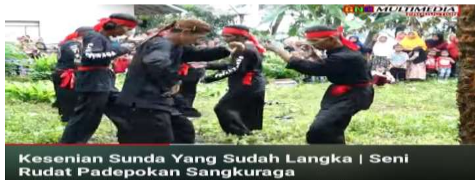
Gambar 4.14 Gerakan Rudot yang mengandung Unsur silat

Berdasarkan sejarahnya, Kesenian Rudot ini dibagi menjadi dua bagian. Bagian pertama, yaitu Kesenian Rudot dengan Gerakan yang mengandung unsur beladiri, dan bagian yang kedua yaitu Kesenian Rudot dengan menggunakan gerakan pola duduk. Kesenian Rudot yang menggunakan gerakan dengan unsur beladiri ini, dimaknai sebagai bentuk perlawanan terhadap Penjajahan Belanda. Sedangkan Kesenian Rudot yang menggunakan gerakan pola duduk dimaknai sebagai bentuk media Dakwah pada suatu daerah. 155