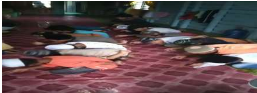
Gambar 4.7 Pola Gerakan tangan saat Naik

kedepan, kemudian jari manis setengah lurus kedepan lebih pendek dari jari tengah, dan jari kelingking lurus kedepan namun lebih pendek dari jari manis.