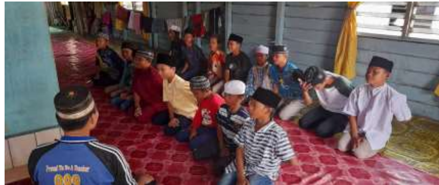
Gambar 4.6 Pola Gerakan Tangan

perbedaan yaitu tangan kanan kedepan dan diletakkan di atas paha kiri perudot, sedangkan Pola Gerakan Ngarak tangan kanan diletakkan dibawah pusat.