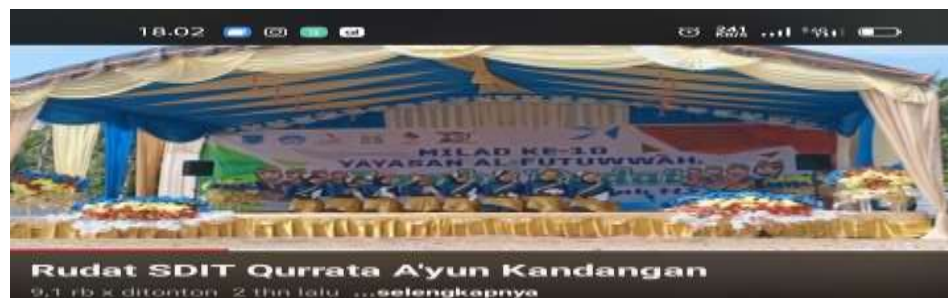
Gambar 4.15 Gerakan Rudot Kalimantan Selatan

Kesenian Rudot pada masyarakat Suku Tidung sangat dipengaruhi dengan Kesenian Rudot yang berasal dari Kalimantan Selatan. Sehingga pola Kesenian Rudot yang ada pada masyarakat Suku Tidung memiliki kesamaan dasar gerakan Pola duduk seperti Kesenian Rudot yang ada di Kalimantan Selatan. Perbedaan dari gerakan Kesenian Rudot yang ada di Kalimantan Selatan dengan yang ada pada masyarakat Suku Tidung adalah bentuk gerakan-gerakannya. Rudot yang ada di Kalimantan Selatan memiliki gerakan yang berbeda-beda (dinamis) disetiap syair yang dibawakan. 160 Sedangkan pada masyarakat Suku Tidung pola gerakannya hanya mengulang-ulang dari gerakan sebelumnya (Statis), hanya sedikit tambahan yang digunakan. 161