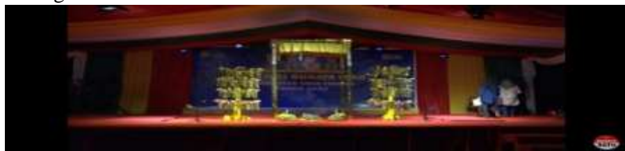
Gambar 4.13 Malay, Penduduk, Nasi Wasur