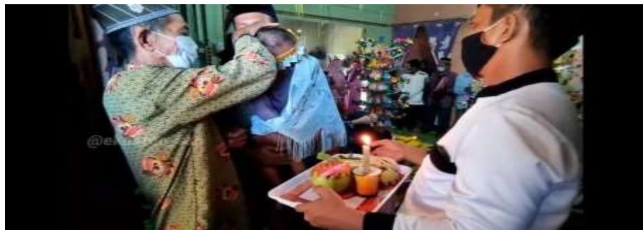
Gambar 4.10 Prosesi Gunting Abuk de Anak

Pada saat Asyarakal berlangsung anak yang telah di Tasmiyahkan tadi diperintahkan untuk mengelilingi Malay Sebanyak tiga kali (ada juga yang mengatakan tujuh kali, namun masyarakat Suku Tidung Kabupaten Malinau lebih menggunakan tiga kali). Anak tersebut digendong oleh orang tua laki-lakinya untuk mengelilingi Malay, kemudian dibantu oleh dua orang yang membawa peralatan-peralatan untuk pelaksanaan Prosesi Gunting Abuk (yang berada dibelakang orang tua laki-laki dari anak). Jadi anak beserta peralatan Gunting Abuk dibawa mengelilingi Malay sebanyak tiga kali.