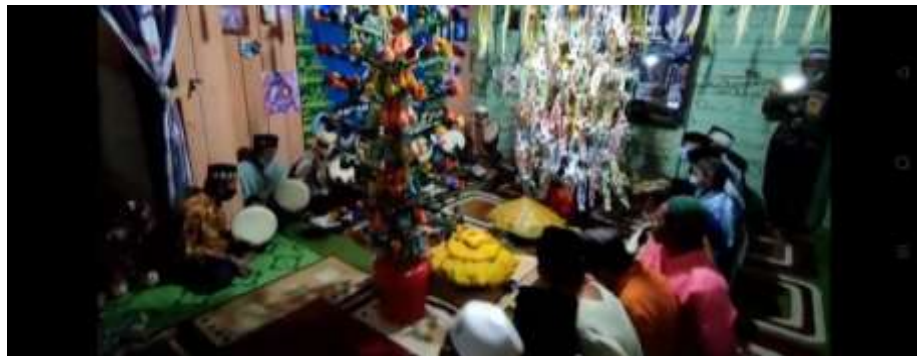
Gambar 4.9 Prosesi Ngarak Malay

Pada saat Prosesi Ngarak Malay ini syair yang dibawakan oleh Imam adalah syair yang berasal dari Kitab Barzanji yaitu Asyrafal anam. Pembacaan Syair tersebut dimulai dari pembuka hingga sampai pada akhir Syair menuju Asyrakal, atau yang biasa dikenal di majelis Hadrah adalah Mahalul Qiyam.