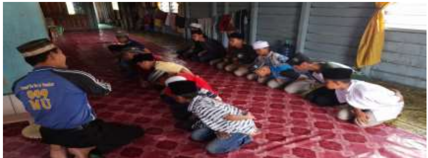
Gambar 4.5 Pola Gerakan posisi Duduk Bunga Melambai

Pola gerakan Bunga Melambai adalah pola gerakan yang hampir sama dengan pola gerakan Bunga Trim. Perbedaan keduanya adalah pada ketukan irama dan bentuk gerakan. Jika Pola Gerakan Bunga Trim dilakukan seperti memutar badan kedepan dari arah kanan. Maka, Pola Gerakan Temudung Bunga Melambai bergerak dari kanan bawah, lalu ketengah, kemudian ke kiri bawah, dan kembali ketengah lagi. Inilah alasan kenapa disebut dengan Bunga Melambai. Karena gerakannya seperti daun yang melambai-lambai.