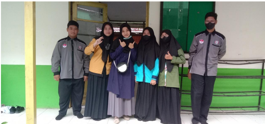
Foto bersama anggota Japanese Community Club SMKN 3 Banjarmasin