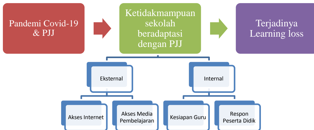
Gambar 2. Proses Terjadinya Learning loss

ketidakmaksimalan proses pembelajaran. 141 Sebaliknya, jika sekolah mampu beradaptasi sebaik mungkin dengan perubahan PJJ selama pandemi covid-19 learning loss dapat terminimalisir. Gambar berikut ini lebih memperjelas pola bagaimana learning loss terjadi.