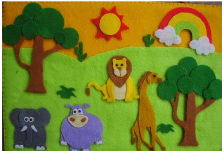
Gambar 4.3 Media Pembelajaran Metode Bercerita Pelaksanaan Treatment

Cerita yang dibawakan oleh guru berupa cerita yang mengandung berbagai nasihat yang ingin disampaikan kepada anak berdasarkan banyaknya kejadian yang terjadi dilapangan dengan menjadikan hewan-hewan sebagai tokoh dalam cerita karena dapat lebih menarik perhatian anak. Melalui metode bercerita peneliti dapat dengan mudah untuk mengetahui keterampilan menyimak anak.