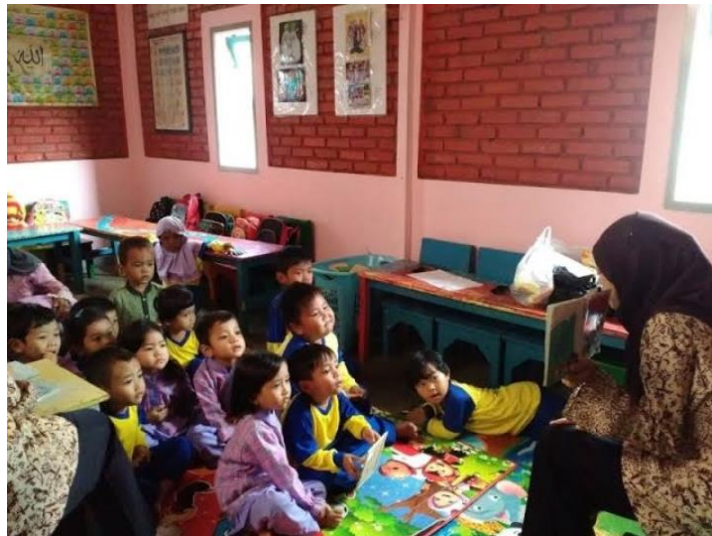
Gambar 4.4 Pelaksanaan Posttest

bercerita. Pengukuran tahap akhir ini dilakukan sebanyak satu kali setelah dilakukan treatment sebanyak tiga kali.