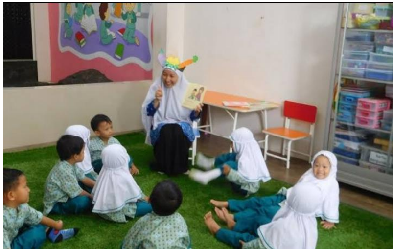
Gambar 4.2 Pelaksanaan Pretest

respon dengan senang, sedih, atau marah sesuai dengan cerita yang didengarkan oleh guru. Hal ini dikarenakan anak belum dapat mengikuti alur dari cerita serta lemahnya keterampilan menyimak anak.