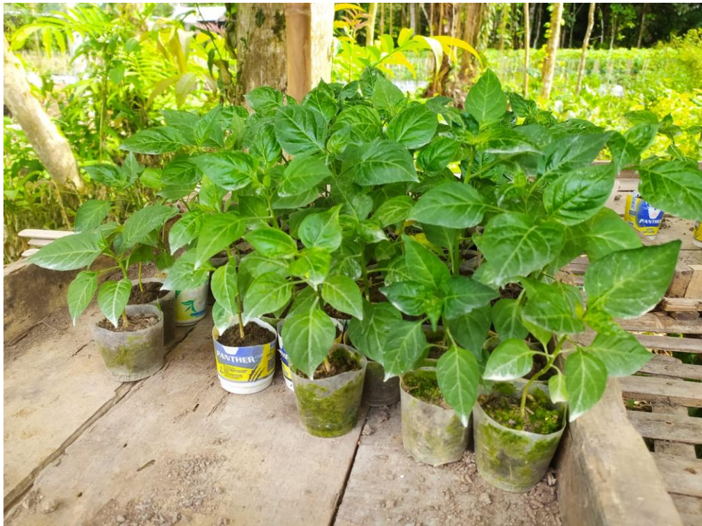
Proses Pembibitan Cabai