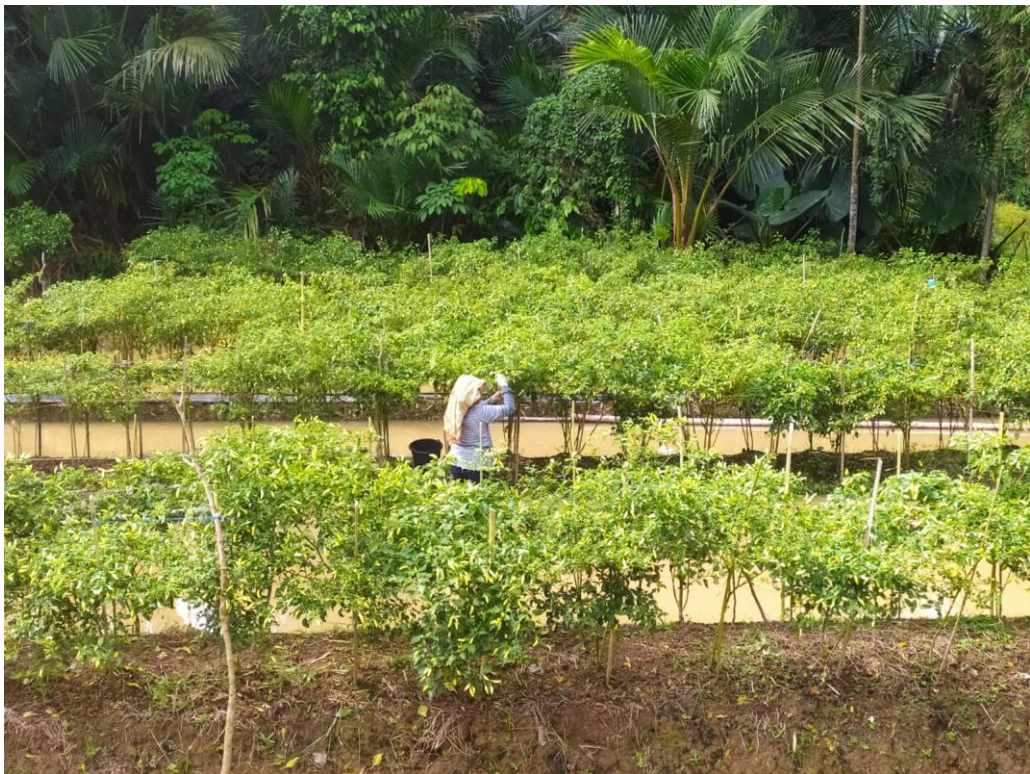
Proses Panen Cabai