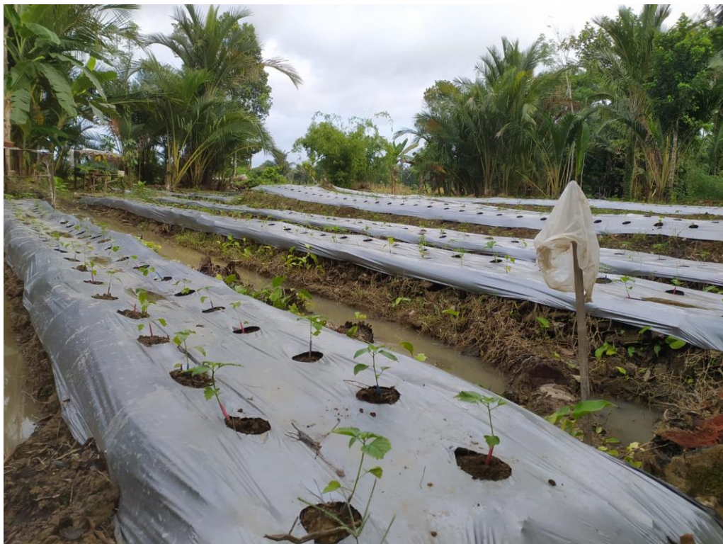
Proses Penanaman Cabai