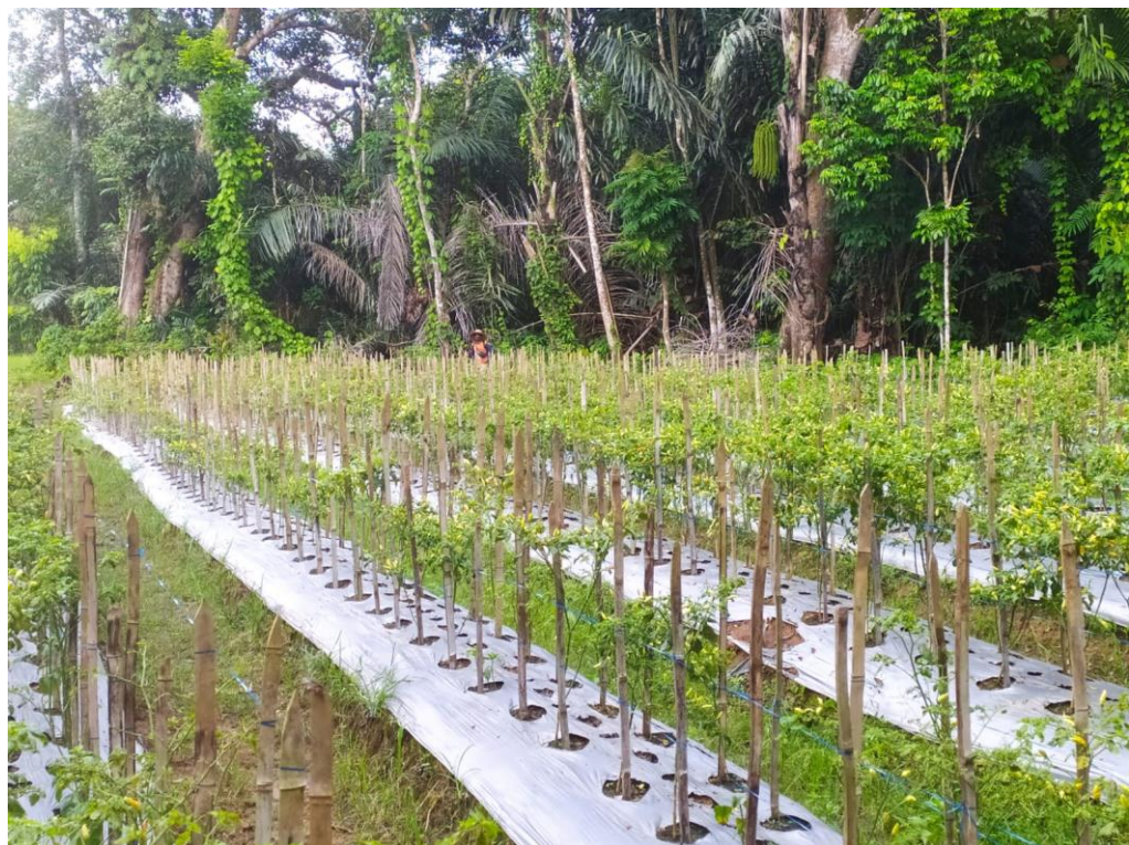
Proses Penyemprotan Dan Pemupukan