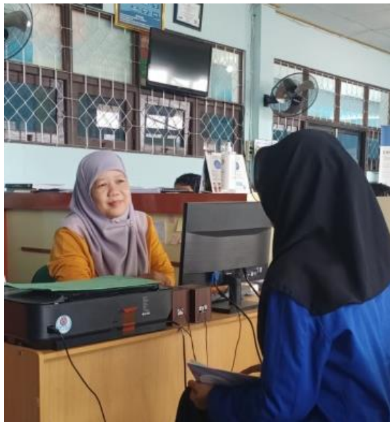
Gambar 1 Wawancara dengan Kepala Perpustakaan UMB dan Pustakawan UMB