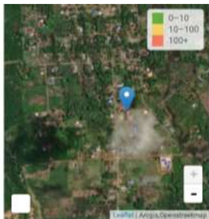
Gambar 3.2 Lokasi SDN Dukuhrejo

Lokasi penelitian yang dilakukan oleh peneliti di SDN Dukuhrejo, yang terletak di Jl. Transmigrasi Km. 37, Desa Dukuh Rejo, Kecamatan Mantewe, Kabupaten Tanah Bumbu, Kalimantan Selatan, ID 72211. SDN Dukuhrejo berada di koordinat Garis Lintang: -3.228 dan Garis Bujur: 115.729