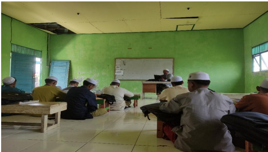
Gambar: 7.7. Kegiatan Belajar Mengajar Di Kelas 3 Ulya Pada Pembelajaran Kitab Fathul Mu'in Di Pondok Pesantren Nurul Hidayah Putera