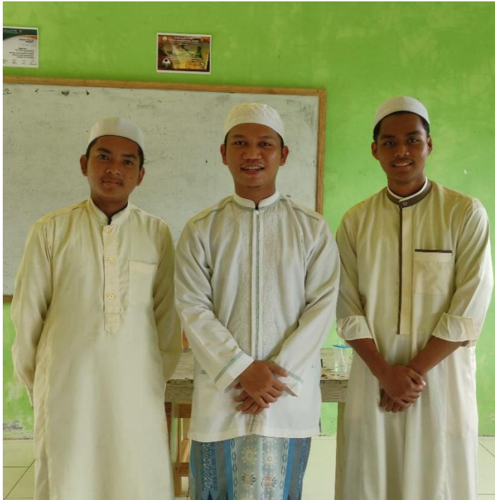
Gambar: 7.6. Wawancara dengan Santri Kelas 3 Ulya Pondok Pesantren Nurul Hidayah Putera yang Belajar Kitab Fathul Mu'in