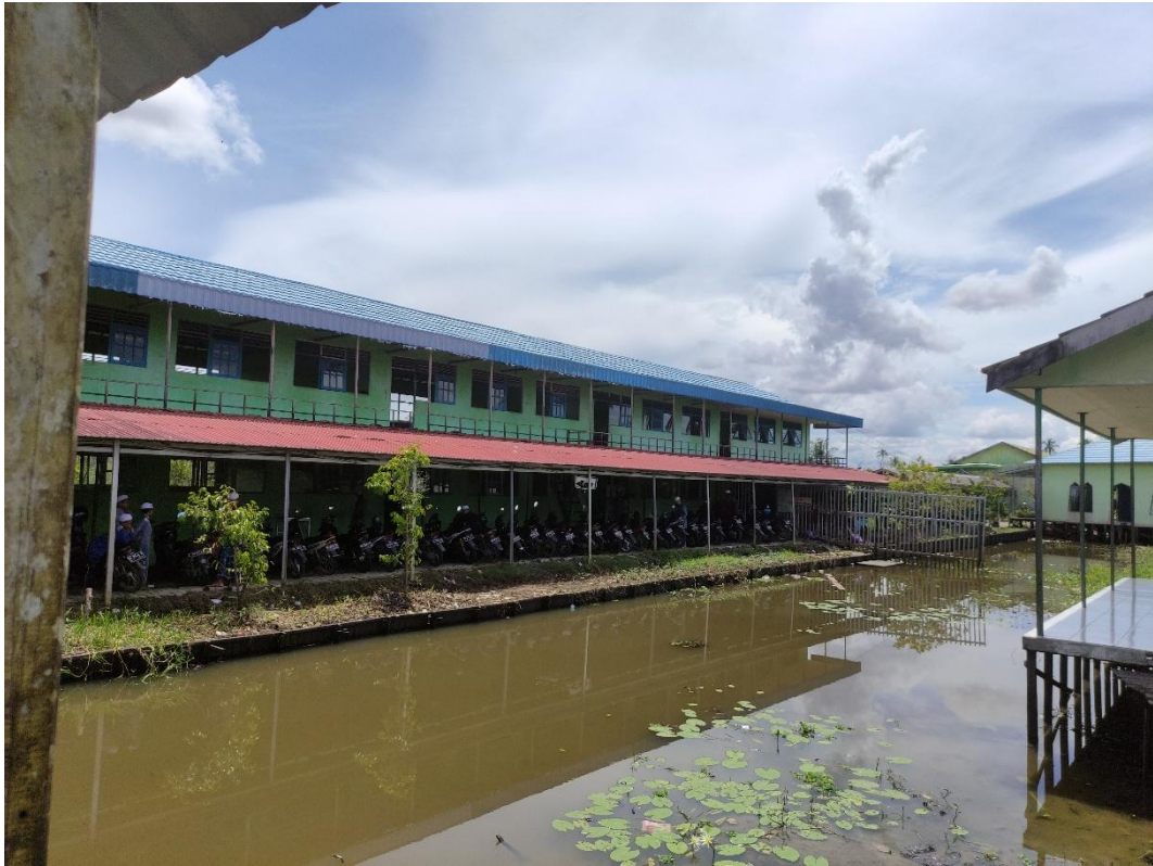
Gambar: 7.3. Ruang Kelas Pondok Pesantren Nurul Hidayah