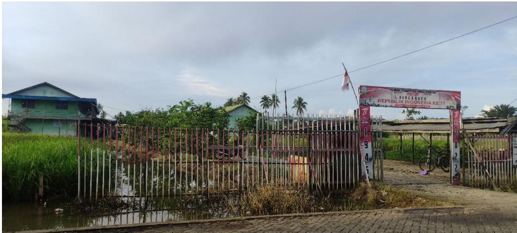
Gambar: 7.1. Bangunan depan Pondok Pesantren Nurul Hidayah Putera