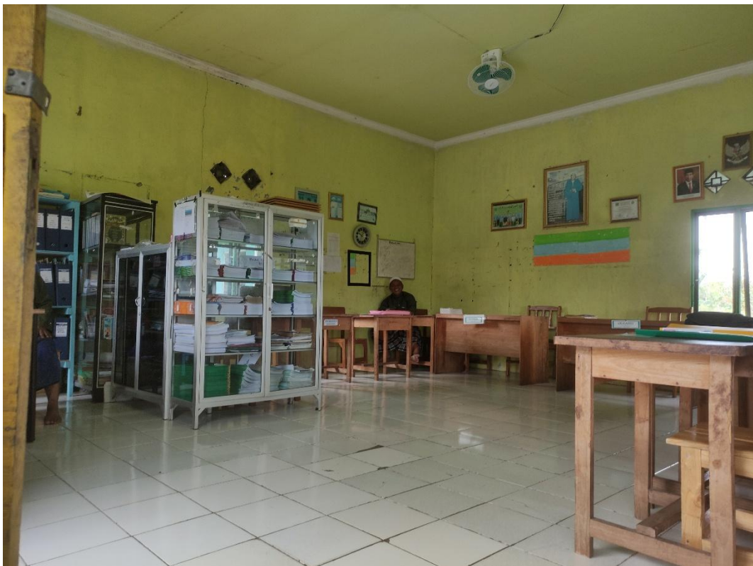
Gambar: 7.2. Kantor Guru dan TU Pondok Pesantren Nurul Hidayah Putera