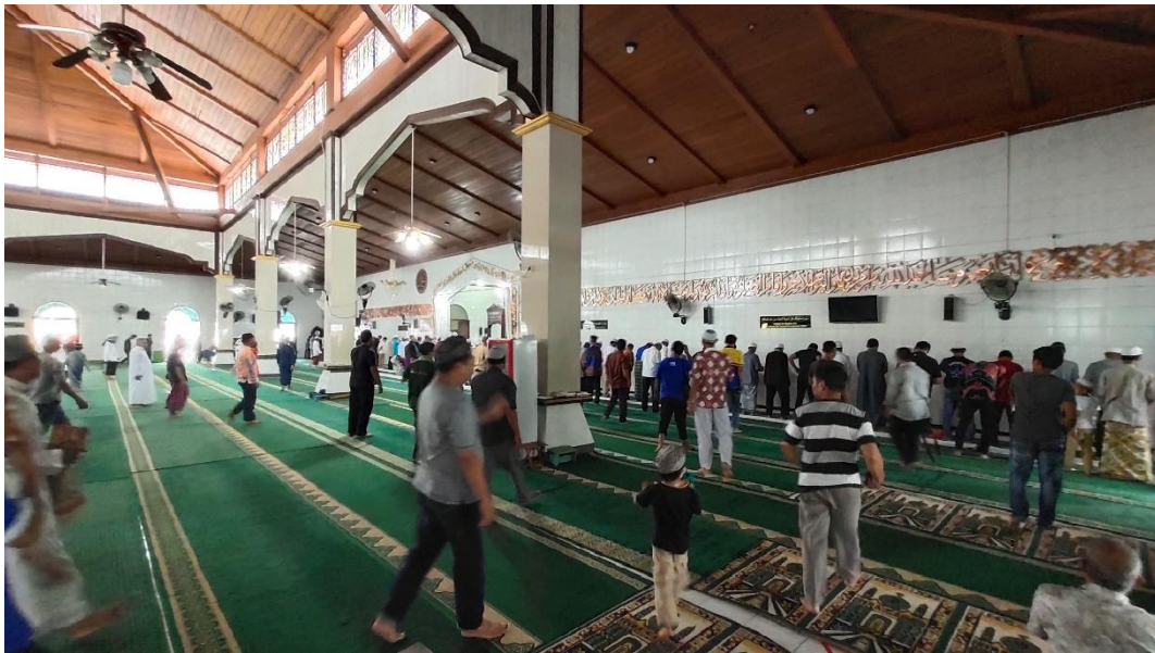
Pelaksanaan Shalat Wajib Lima Waktu