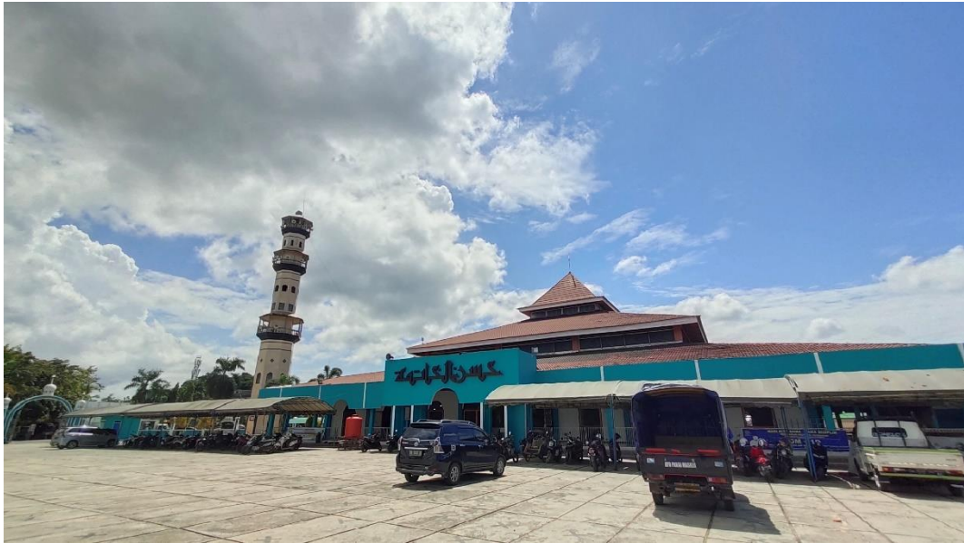
Masjid Agung Husnul Khatimah Kotabaru (2022)