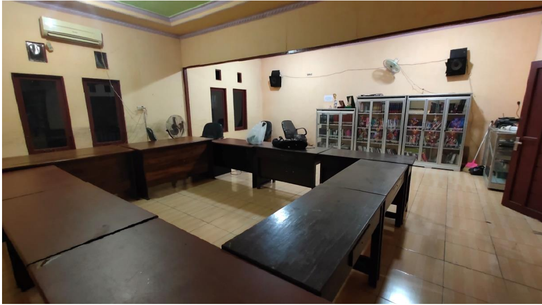
Perpustakaan Masjid Agung Husnul Khatimah Kotabaru