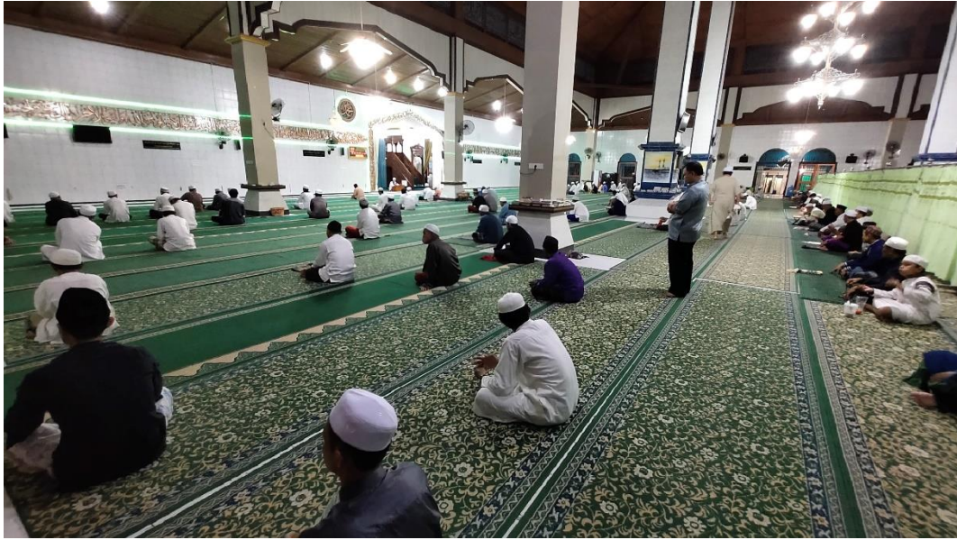
Kegiatan Majelis Taklim