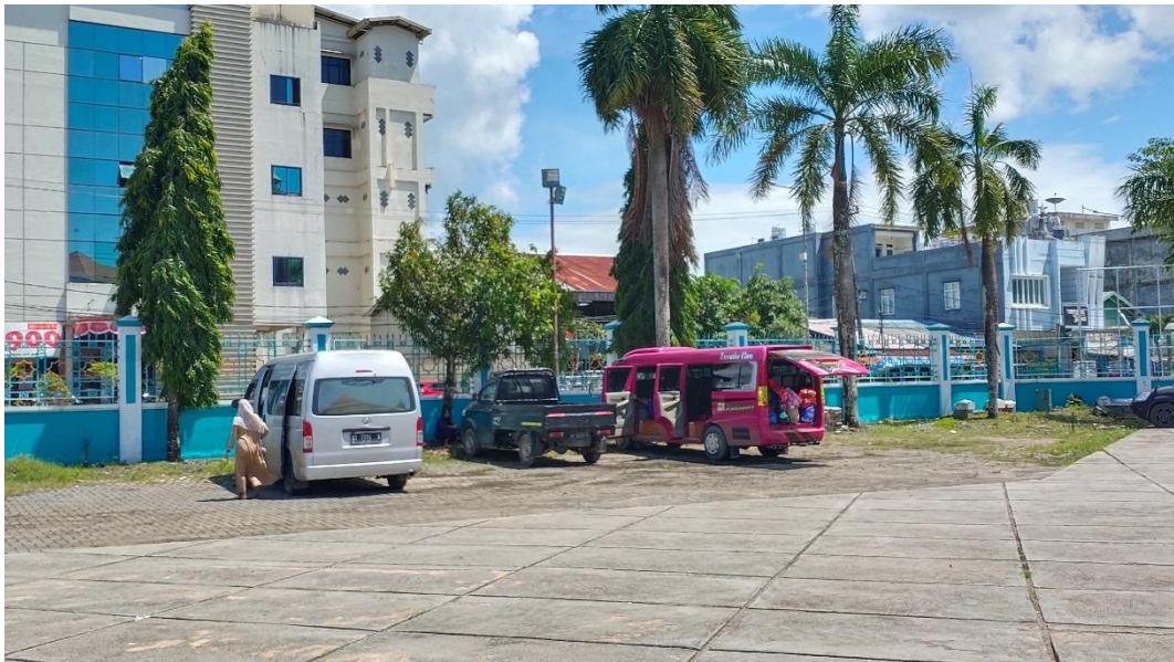
Bus Rombongan Jamaah dari luar Kabupaten Kotabaru