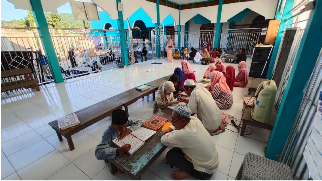
Kegiatan TPA/TPQ Masjid Agung Husnul Khatimah Kotabaru