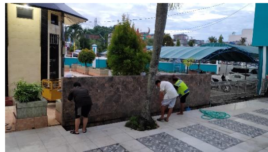
Tempat Wudhu Indoor dan Outdoor Masjid Agung Husnul Khatimah Kotabaru