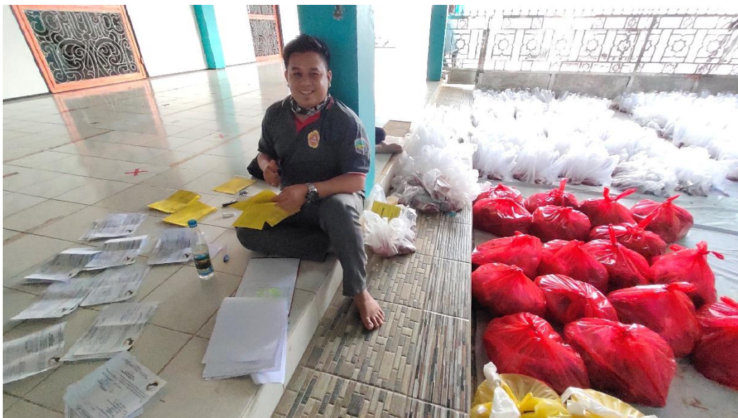
Pendistribusian Daging Hewan Qurban