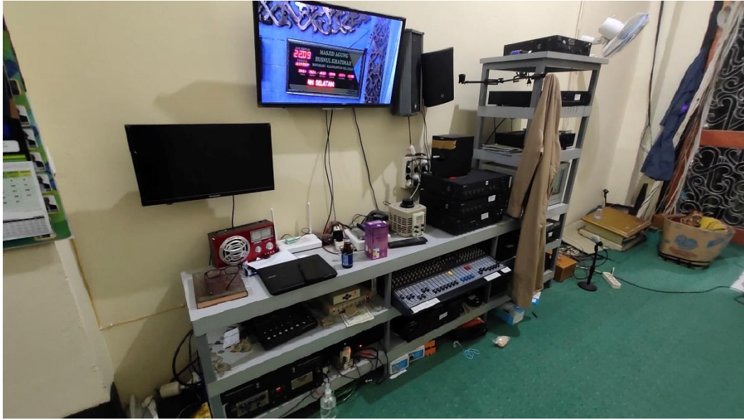
Ruang Media Masjid Agung Husnul Khatimah Kotabaru (Ri'ayah)