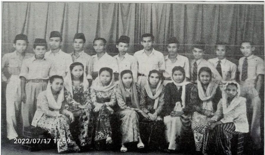
Siswa-siswi SMIP-1946 Angkatan Pertama