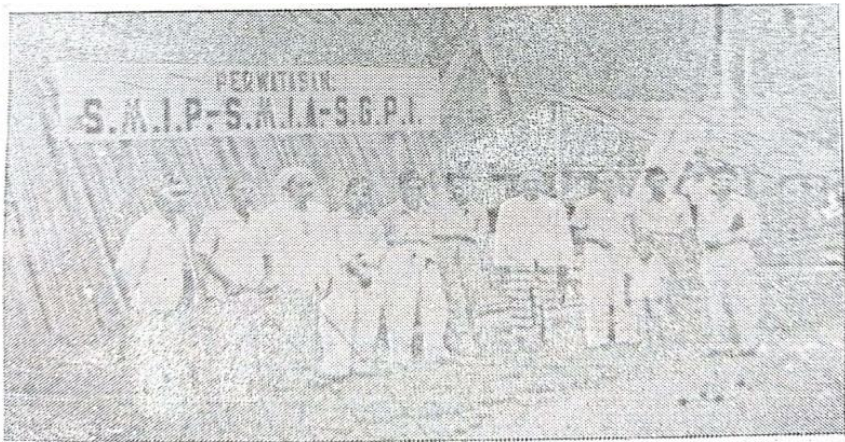
Pembangunan gedung SMIP 1946 Jl. Masjid Surgi Mufti Banjarmasin.

Gagasan awal pendirian lembaga pendidikan Islam ini sesungguhnya tidak diniatkan atau dimaksudkan hanya untuk mendirikan sekolah Islam tingkat pertama saja, tetapi meliputi juga sekolah menengah tingkat atas (SMIA) dan Sekolah Guru Pendidikan Islam (SGPI), sebagaimana terlihat pada gambar di bawah.