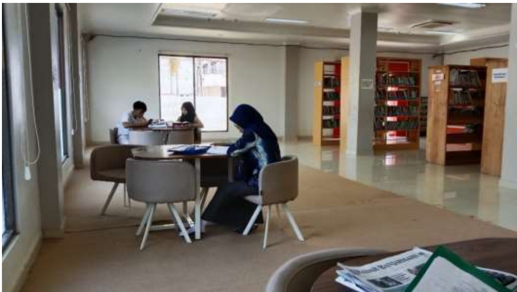
Gambar ruang baca