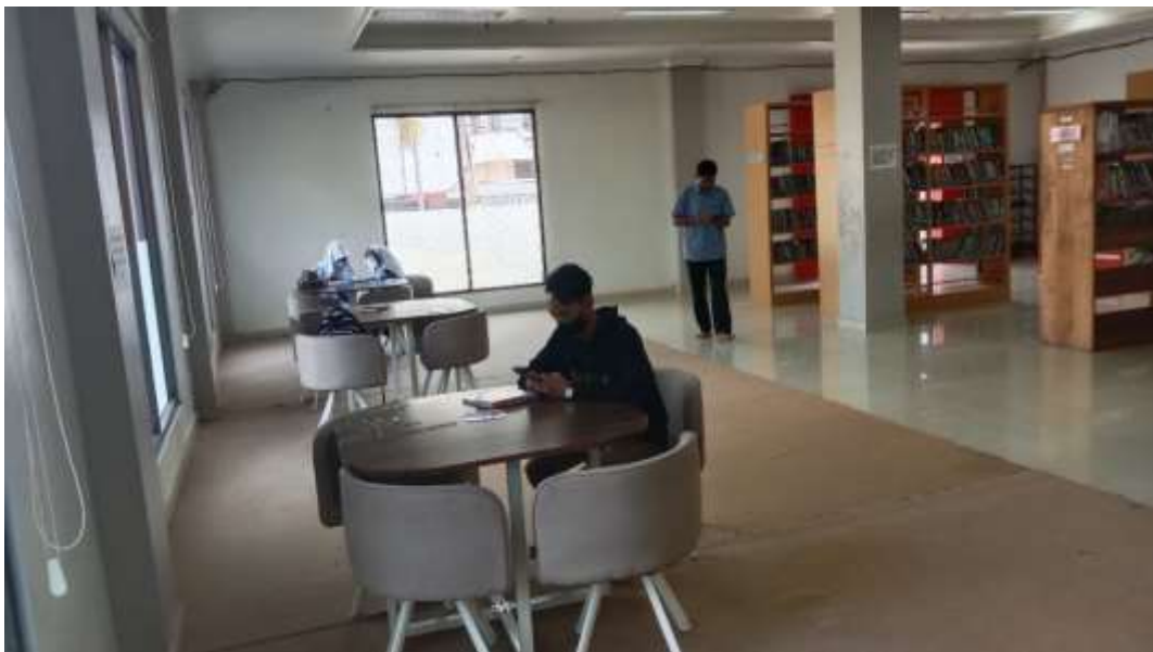
Gambar ruang baca