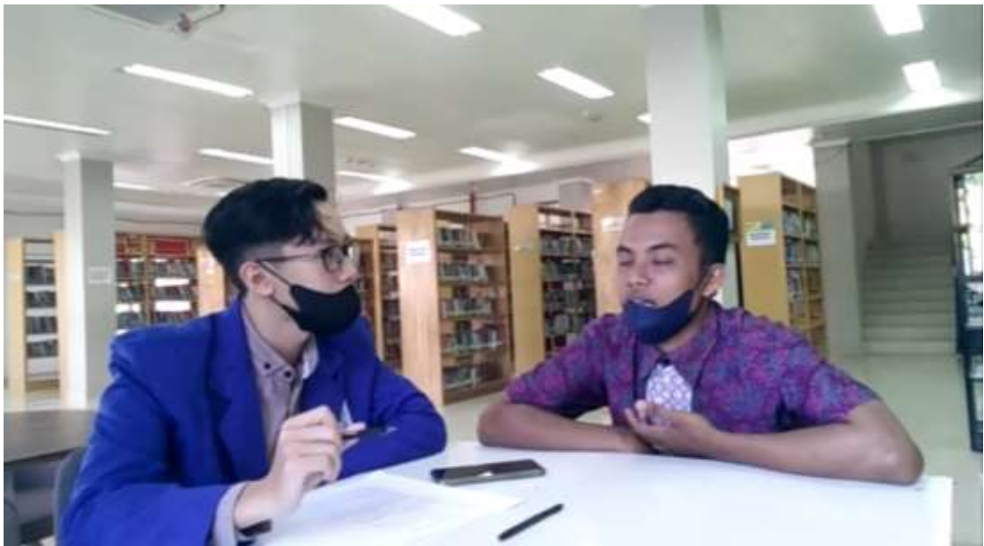
Gambar wawancara dengan pustakawan