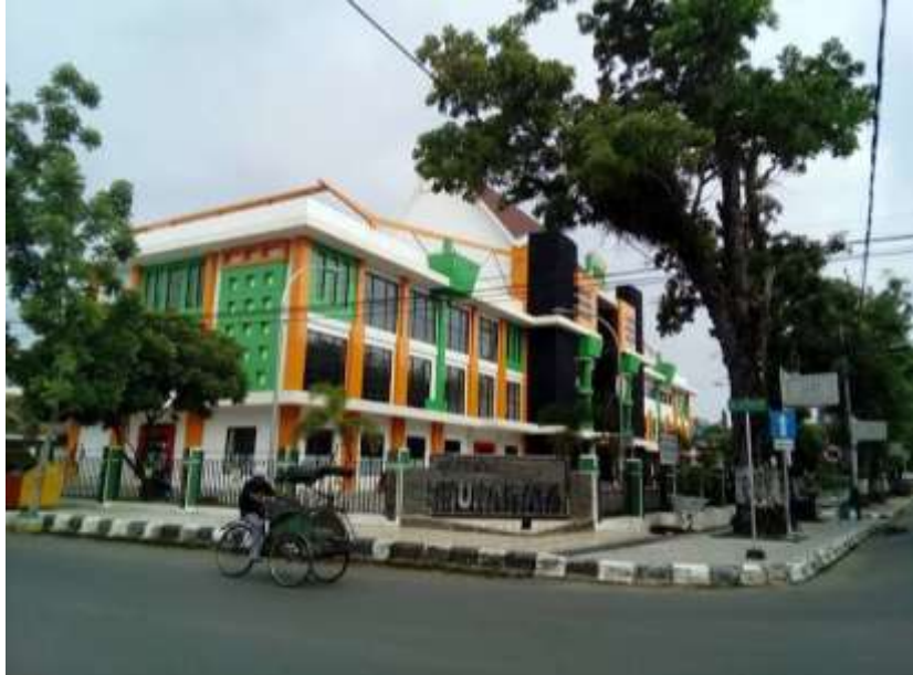
Gambar gedung Dinas Perpustakaan Kabupaten Hulu Sungai Tengah