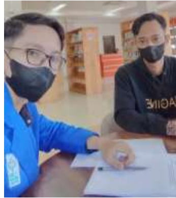
Gambar wawancara dengan pemustaka