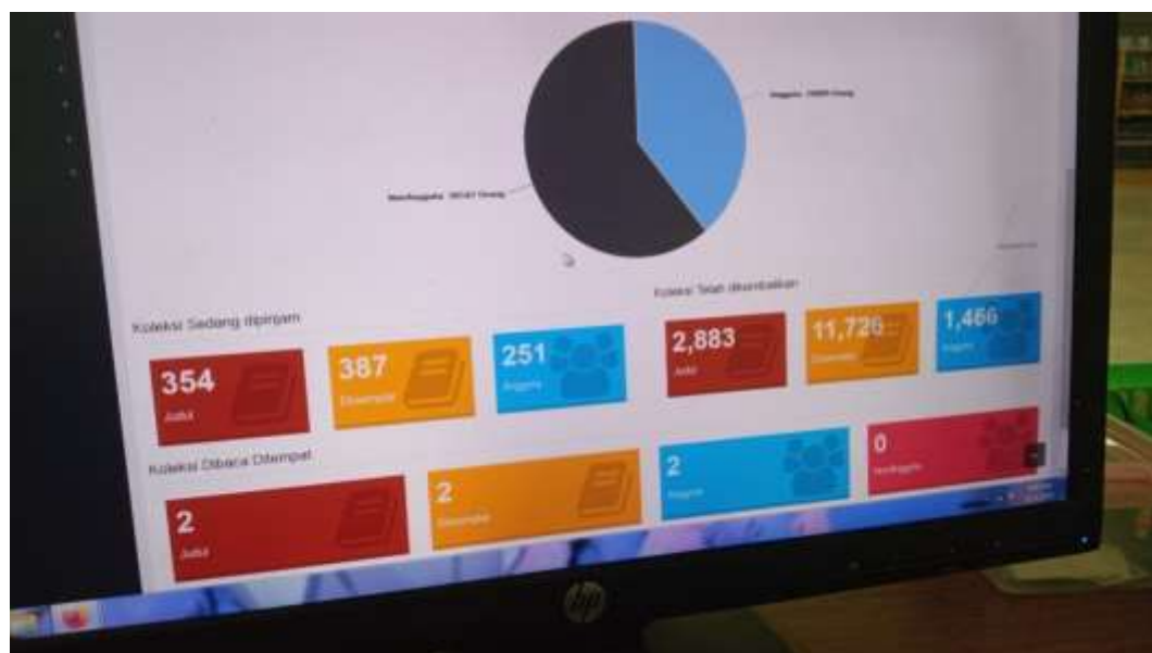
Gambar otomatisasi perpustakaan menggunakan INLIS