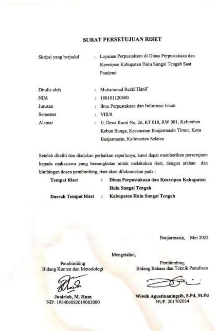
Surat Persetujuan Riset