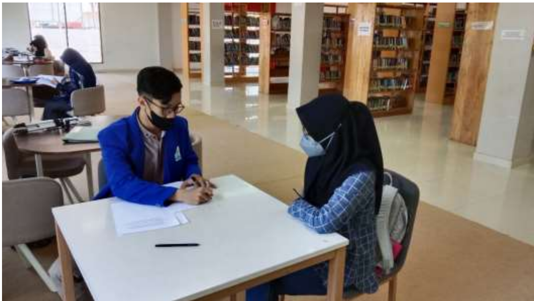
Gambar wawancara dengan pemustaka