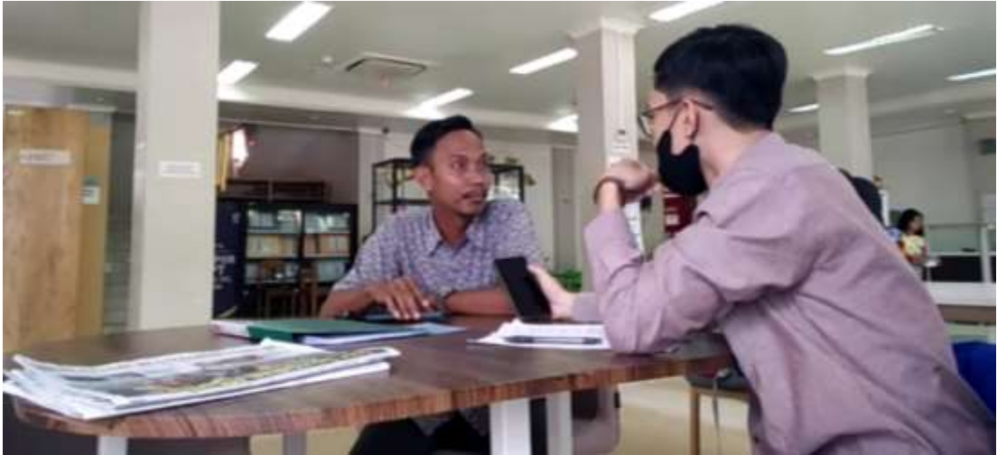
Gambar wawancara dengan pustakawan