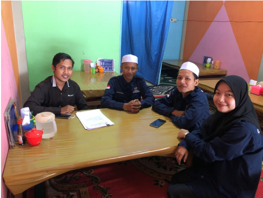
Lampiran 4 Observasi Kegiatan Proyek Sosial di Panti Asuhan Griya Yatim