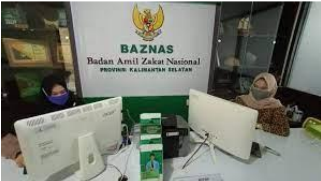
Lampiran 2 Ruang Pelayanan BAZNAS Kalsel