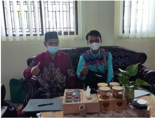
Gambar 11 : Dokumentasi kegiatan pojok baca