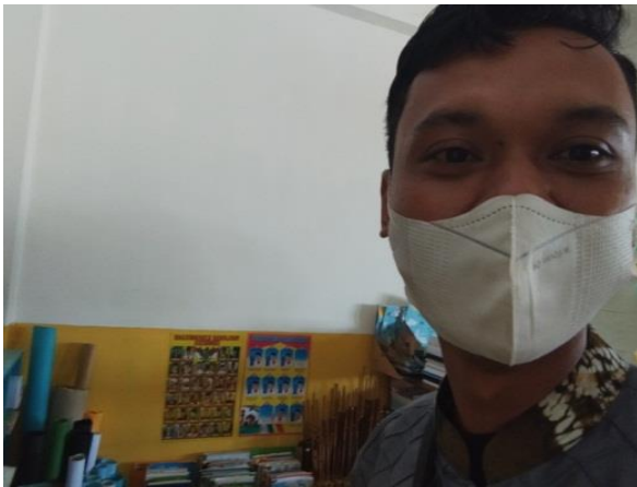
Gambar 6 : Dokumentasi payung baca