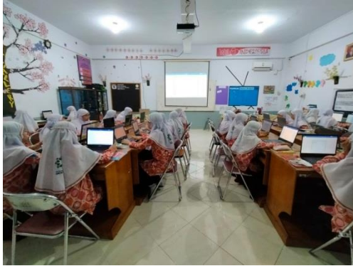
Gambar 14 : Dokumentasi kegiatan literasi baca tulis di cafe buku