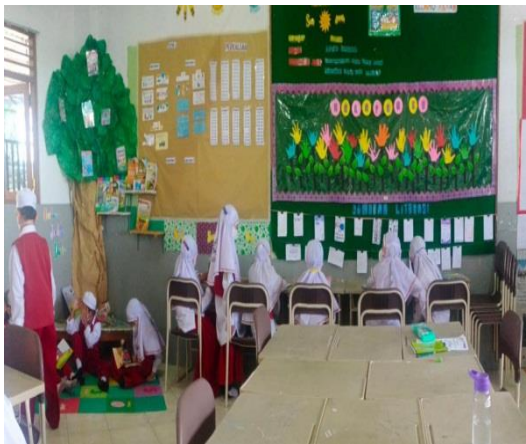
Gambar 12 : Dokumentasi kegiatan literasi digital