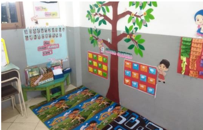
Gambar 3 : Dokumentasi ruang pojok baca kelas