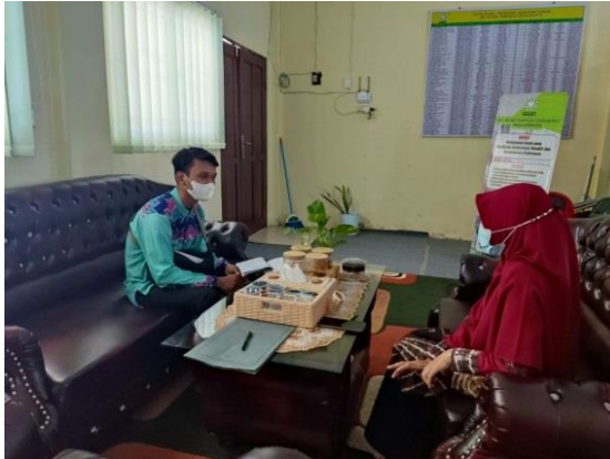
Gambar 8 : Dokumentasi wawancara dengan kepala sekolah, wakil kepala sekolah dan guru kelas