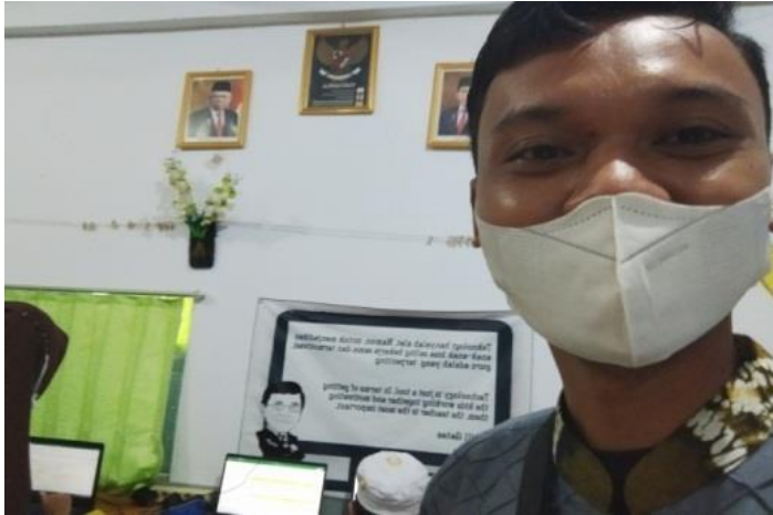
Gambar 2 : Dokumentasi ruang pojok baca kelas