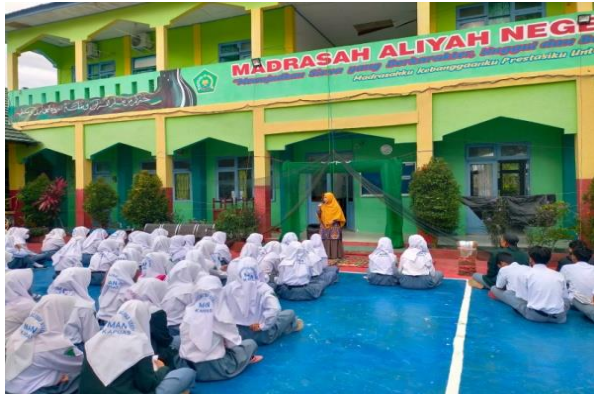
Layanan Kelas Besar atau Lintas Kelas Oleh Guru BK