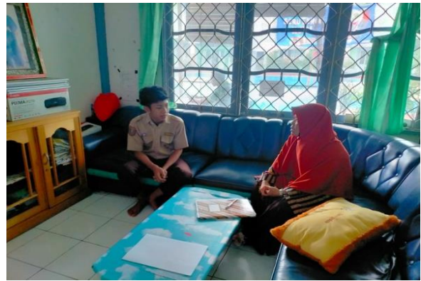
Konseling Individual Oleh Guru BK