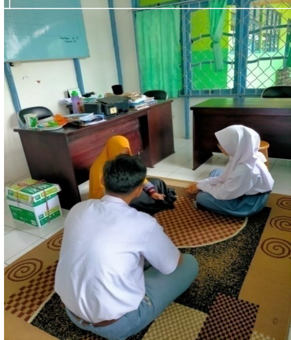
Bimbingan Kelompok Oleh Guru BK