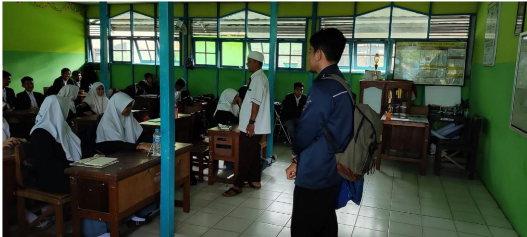
Bimbingan Klasikal Oleh Guru BK

Layanan Bimbingan dan Konseling Oleh Guru BK di MAN Kapuas