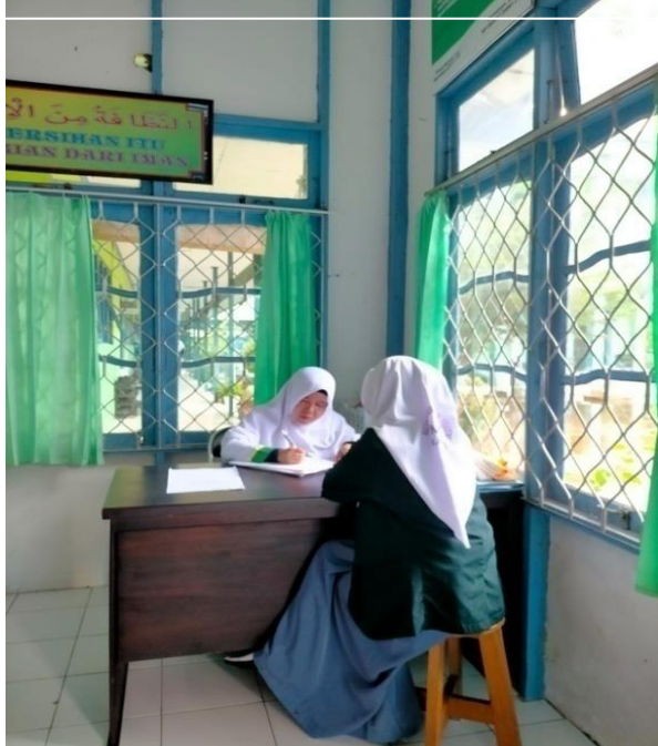
Layanan Bimbingan Karir Oleh Guru BK