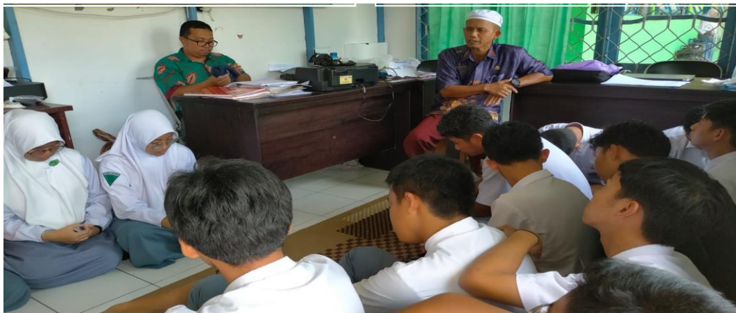
Layanan Konseling Kelompok Oleh Guru BK