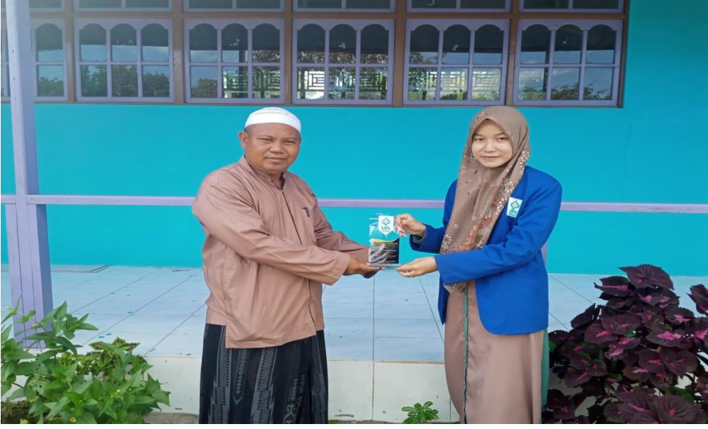
مع رئيس مدرسة الطاهرية المتوسطة الإسلامية