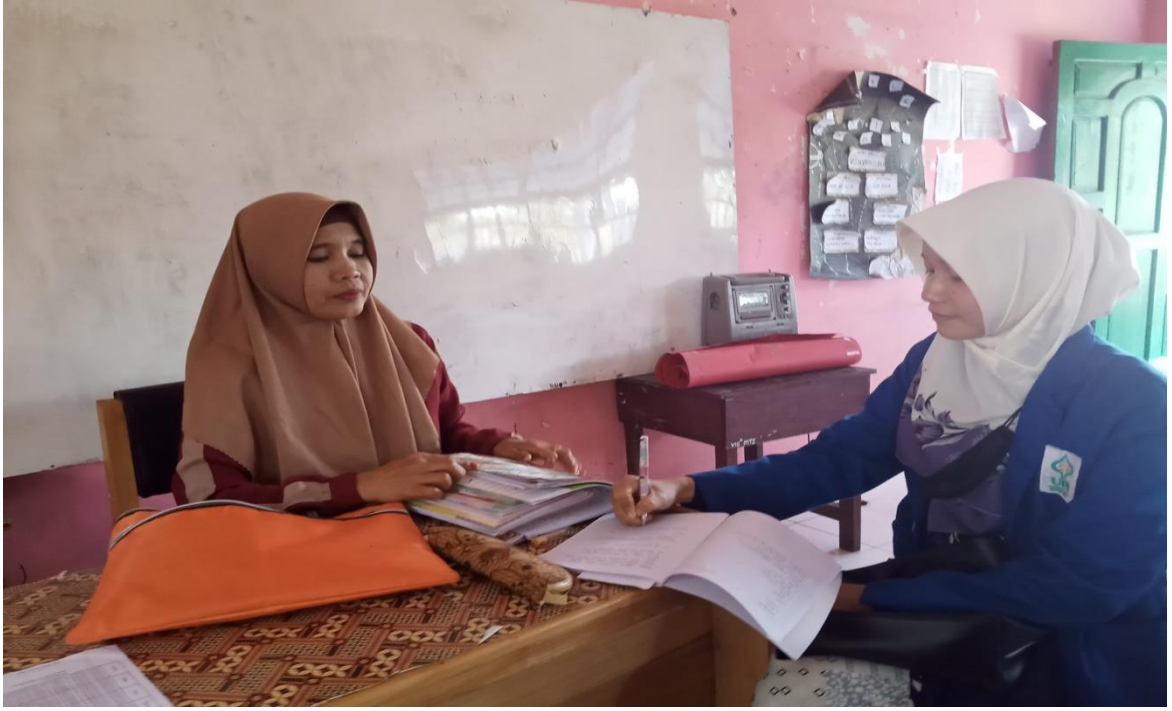
المقابلة مع بعض الطلبة