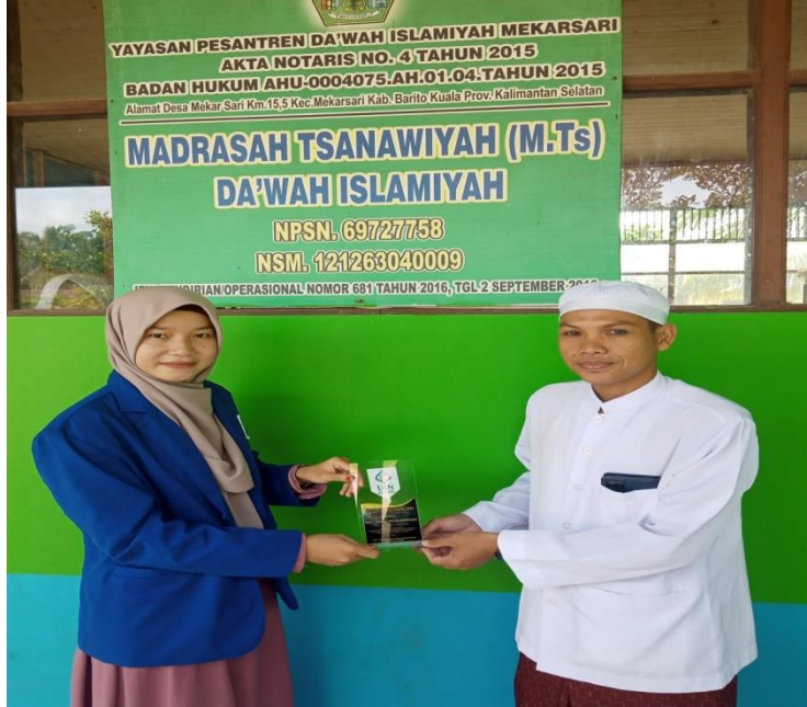
مع رئيس مدرسة الدعوة الإسلامية المتوسطة الإسلامية