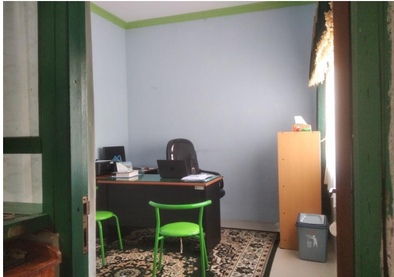
(Ruang Kepala Kasi Penyelenggara Haji dan Umrah)