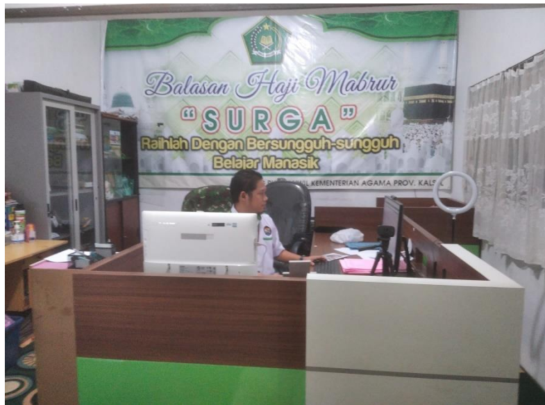
(Ruang operator Siskohat)