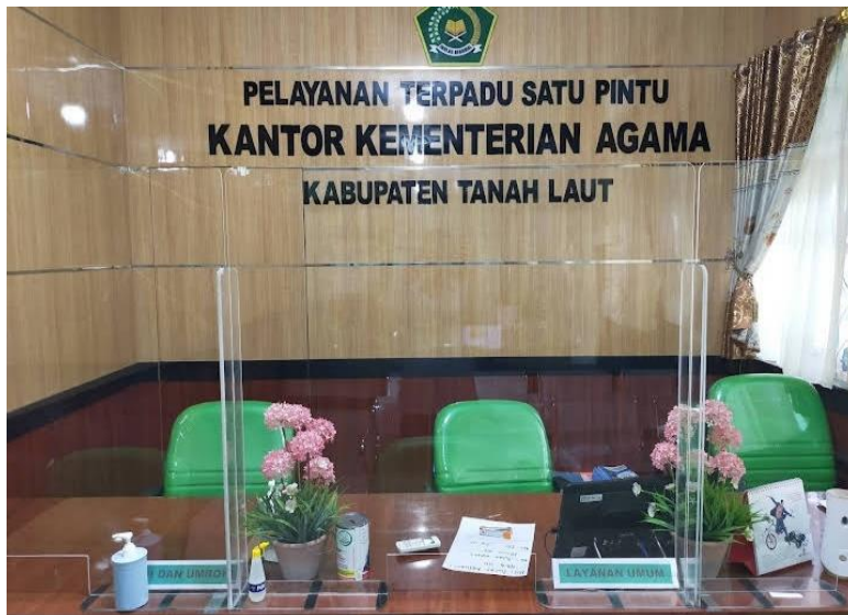
(Ruang Pelayanan Terpadu Satu Pintu)