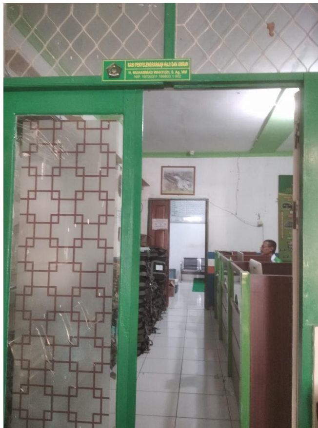
(Ruang Kasi Penyelenggara Haji dan Umrah)