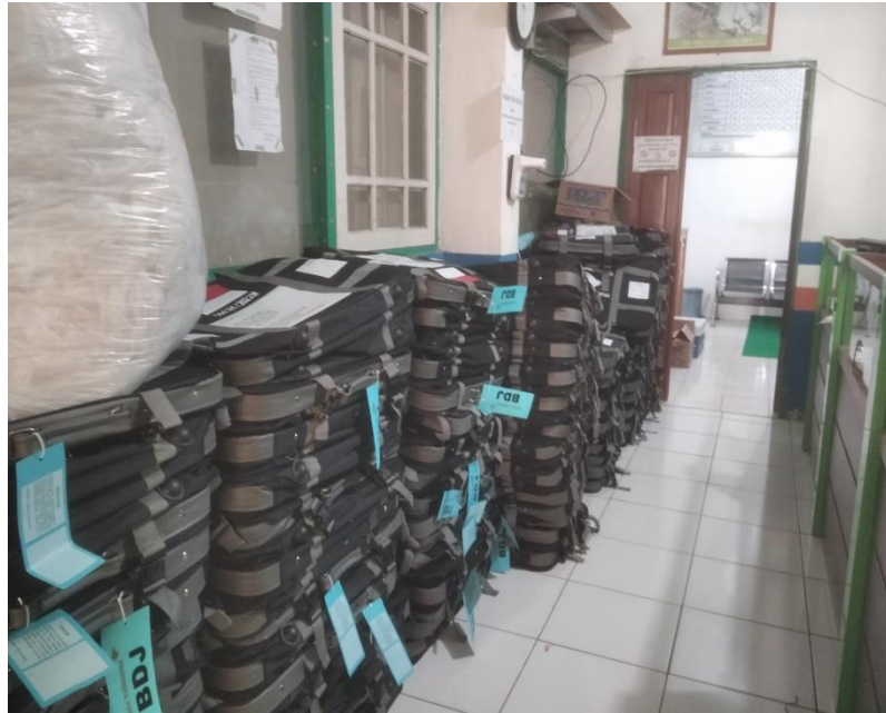
(Koper jamaah haji di ruang depan yaitu ruang pelayanan)