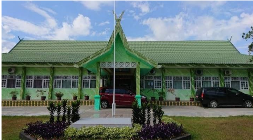
(Kantor Kementerian Agama Kabupaten Tanah Laut)