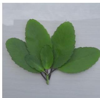
Gambar 4.4. Daun Cocor Bebek

Kingdom : Plantae Divisi : Magnoliophyta Kelas : Magnoliopsida Ordo : Saxifragales Famili : Crassulaceae Genus : Kalanchoe Spesies : Kalanchoe pinnata Pers.