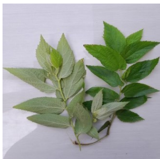
Gambar 4.2. Daun Kersen

Kingdom : Plantae Divisi : Spermatophyta Kelas : Dicotyledoneae Ordo : Malvales Famili : Elaeocarpaceae Genus : Muntingia Spesies : Muntingia calabura L.