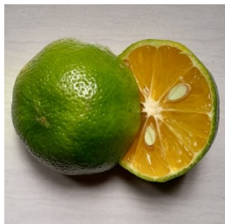
Gambar 4.8. Buah Jeruk Nipis