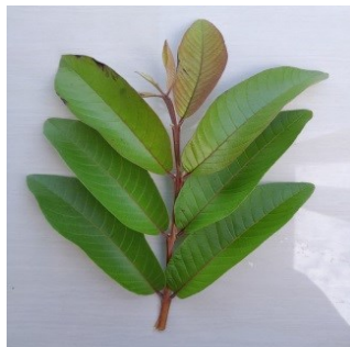
Gambar 4.6. Daun Jambu Biji