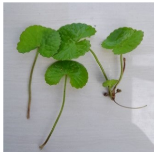
Gambar 4.3. Daun Pegagan

Divisi : Magnoliophyta Kelas : Magnoliopsida Ordo : Apiales Famili : Apiaceae Genus : Centella Spesies : Centella asiatica L.