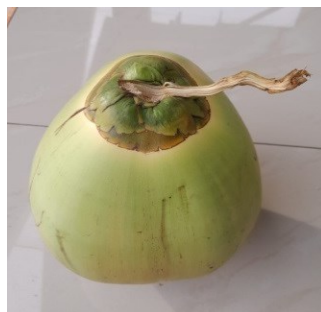
Gambar 4.9. Buah Kelapa