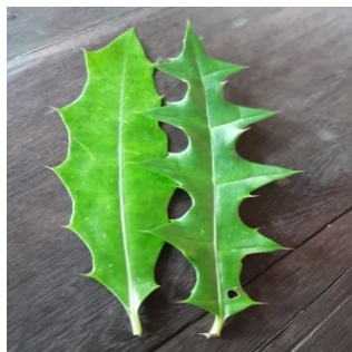
Gambar 4.12. Daun Jeruju