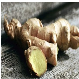
Gambar 4.17. Kunyit Putih

Kingdom : Plantae Divisi : Magnoliophyta Kelas : Liliopsida Ordo : Zingiberales Famili : Zingiberaceae Genus : Curcuma Spesies : Curcuma sedoaria