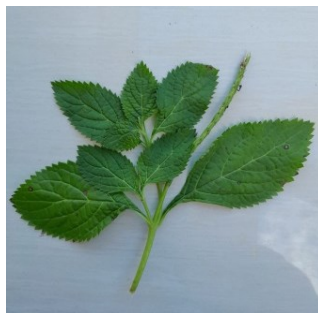
Gambar 4.7. Daun Jarong

Kindom : Plantae Divisi : Magnoliophyta Kelas : Magnoliopsida Ordo : Lamiales Famili : Verbenaceae Genus : Stachytarpheta Spesies : Stachytarpheta indica Vahl.