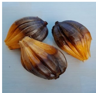
Gambar 4.15. Buah Nipah

Kindom : Plantae Divisi : Magnoliophyta Kelas : Liliopsida Ordo : Areales Famili : Arecaceae Genus : Nypa Spesies : Nypa fruticans