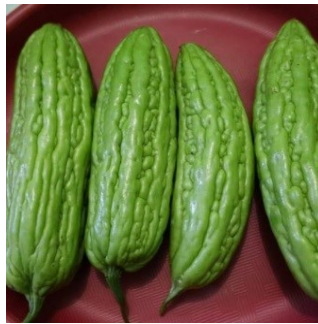
Gambar 4.18. Buah pare

Divisi : Spermatophyta Kelas : Dicotyledonae Ordo : Cucurbitales Famili : Cucurbitaceae Genus : Momordica Spesies : Momordica charantia L.