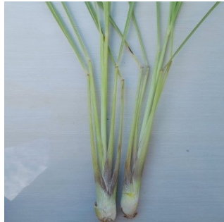
Gambar 4.21. Batang Serai