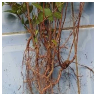
Gambar 4.11. Akar Karamunting