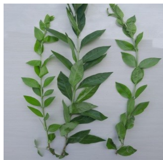
Gambar 4.5. Daun Pacar/Inai

Divisi : Magnoliophyta Kelas : Magnoliopsida Ordo : Myrtales Famili : Lythraceae Genus : Lawsonia Spesies : Lausonia inermis