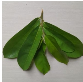
Gambar 4.20. Daun Sirsak

Kingdom : Plantae Divisi : Spermatophyta Kelas : Dicotyledoneae Ordo : Ranales Famili : Annonaceae Genus : Annona Spesies : Annona muricata Linn.