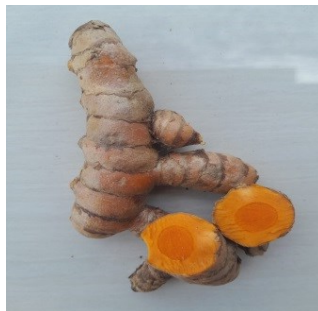
Gambar 4.16. Kunyit