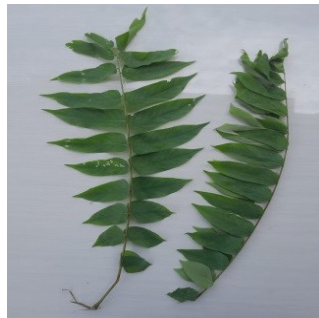
Gambar 4.1. Daun Belimbing Wuluh

Kelas : Magnoliopsida Ordo : Geraniales Famili : Oxalidaceae Genus : Averrhoa Spesies : Averrhoa bilimbi L.