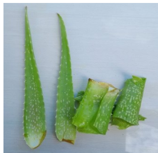
Gambar 4.13. Daun Lidah Buaya

Kingdom : Plantae Divisi : Spermatophyta Kelas : Liliopsida Ordo : Asparagales Famili : Asphodelaceae Genus : Aloe Spesies : Aloe vera L.