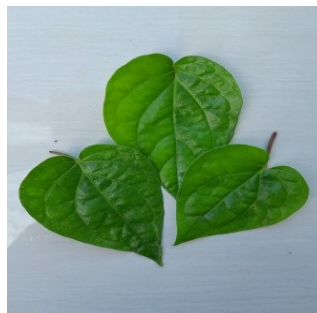
Gambar 4.22. Daun Sirih

Kindom : Plantae Divisi : Magnoliophyta Kelas : Magnoliopsida Ordo : Piperales Famili : Piperaceae Genus : Piper Spesies : Piper betle L.