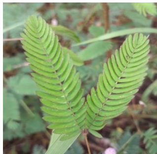
Gambar 4.23. Daun Putri Malu