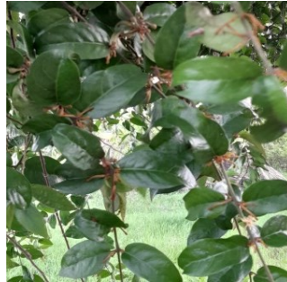
Gambar 4.14. Daun Benalu Kersen