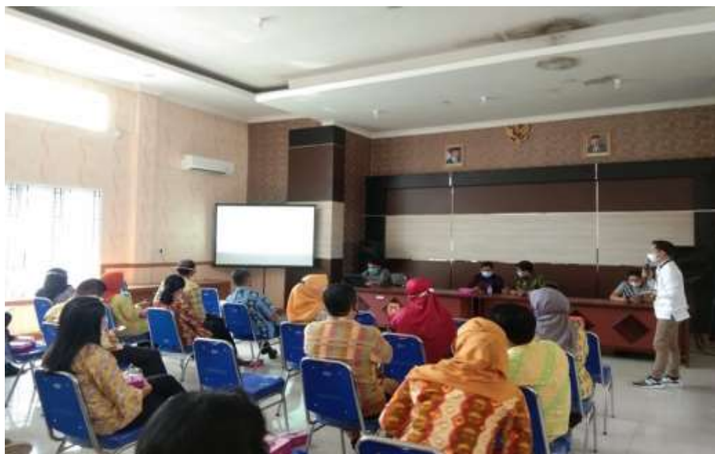
UMKM Di Pangkalan Bun