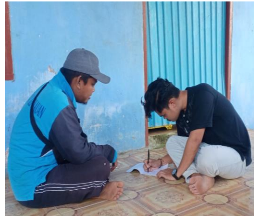
3. Wawancara dengan Masyarakat Tanjung lalak selatan.