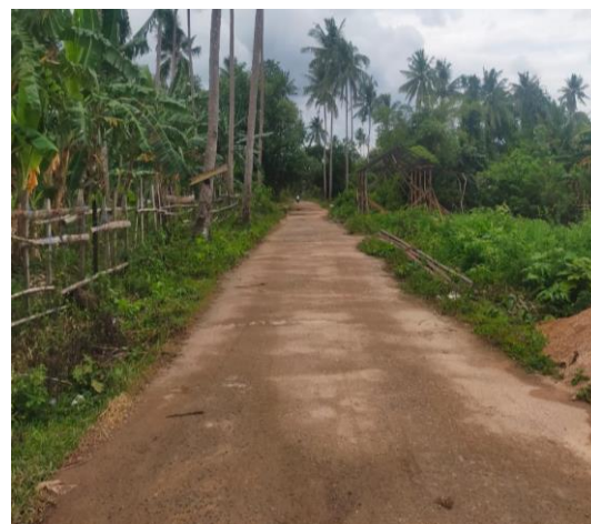
4. Kondisi Desa Tanjung lalak selatan.