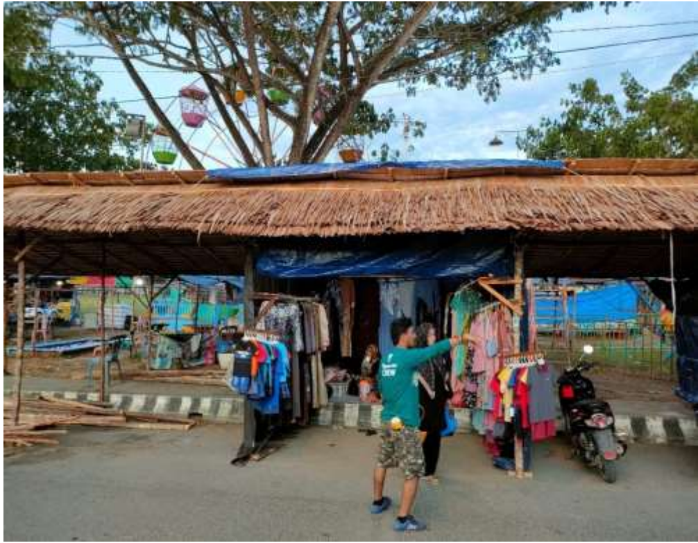
Kondisi stan Pesta Pantai Pagatan