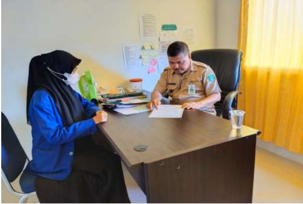
Wawancara sekaligus kunjungan ke Kantor Kecamatan Kusan Hilir