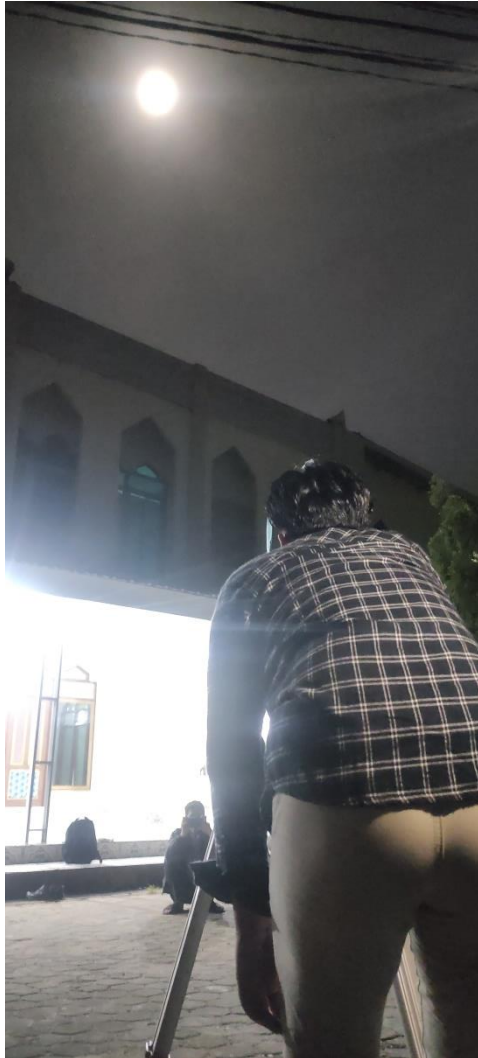
Gambar 6.3. Pembidikan Bulan di Masjid Abdurrahman Ismail