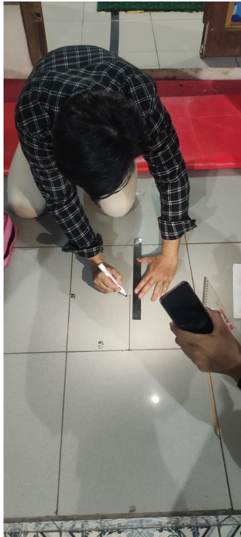
Gambar 6.5. Proses Pembuatan Garis Saf Masjid Abdurrahman Ismail