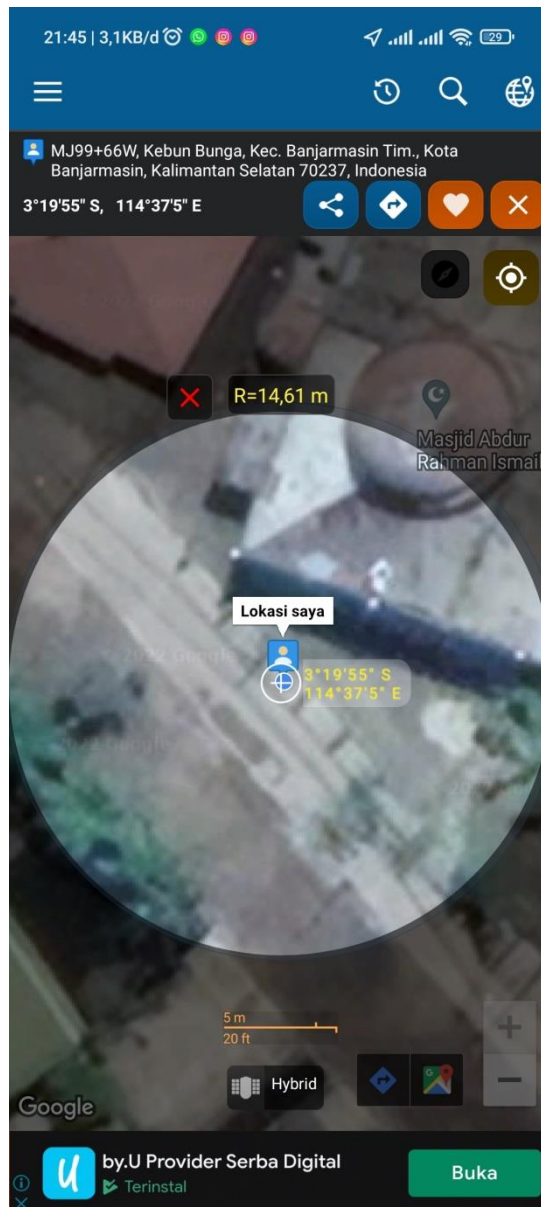
Gambar 6.1. Lokasi Penelitian di Masjid Abdurrahman Ismail