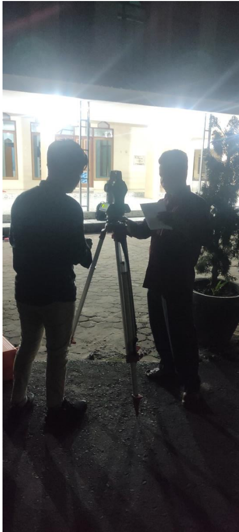
Gambar 6.2. Persiapan Penelitian di Masjid Abdurrahman Ismail