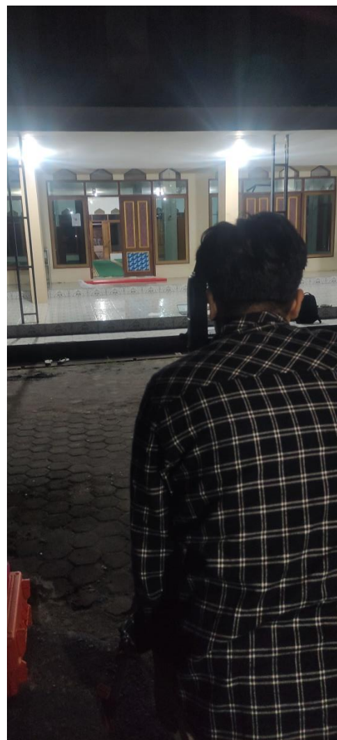
Gambar 6.4. Pembidikan Saf Masjid Abdurrahman Ismail