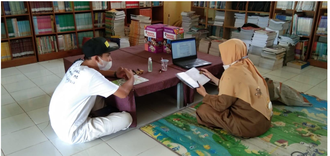
Foto kegiatan wawancara dengan informan remaja pelajar SMAN 2 Martapura