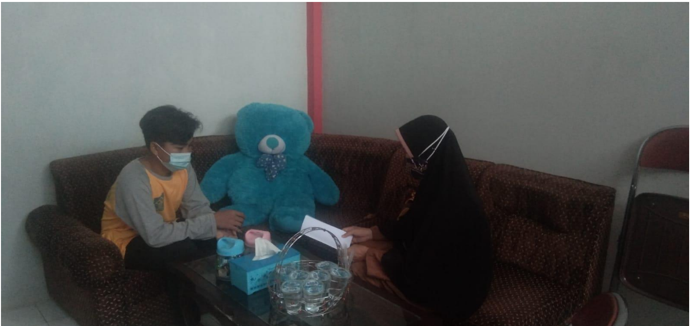
Foto wawancara dengan informan SMAN 2 Martapura di Lapas Anak Martapura