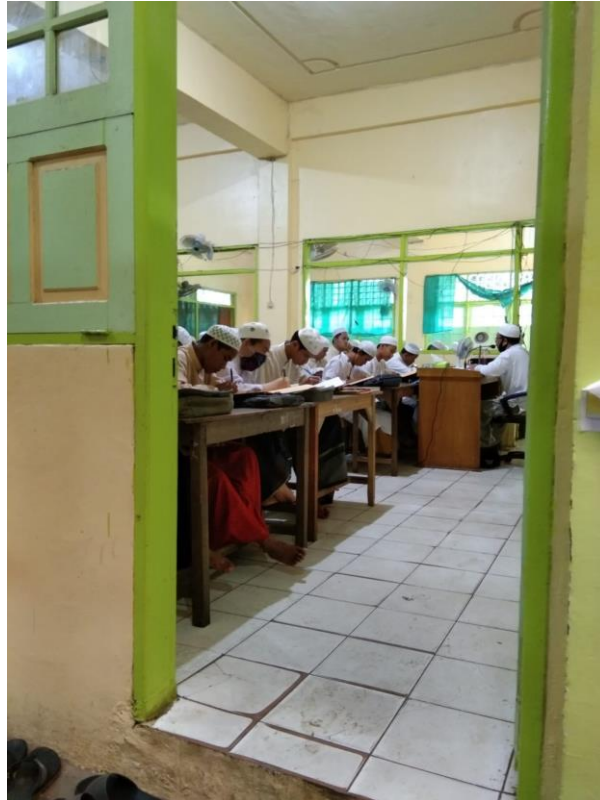
foto kegiatan Proses Pembelajaran tatap muka di pondok pesantren Darussalam