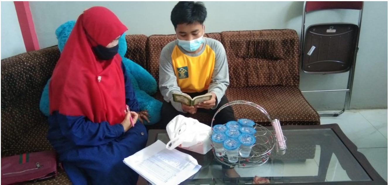
Foto kegiatan proses bimbingan siswa mu'allaf