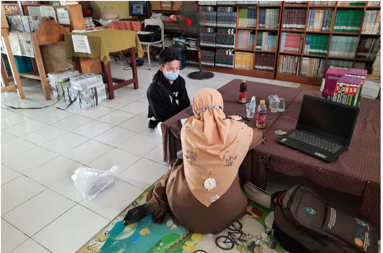
Foto kegiatan wawancara dengan remaja pelajar SMAN 2 Martapura