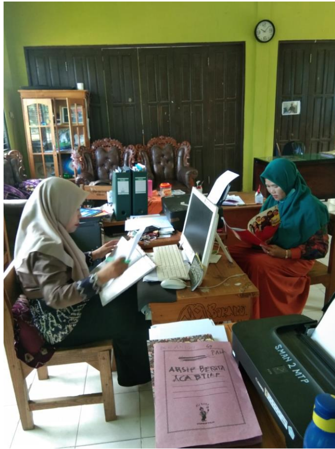
Foto kegiatan memasukkan surat ijin penelitian ke SMAN 2 Martapura