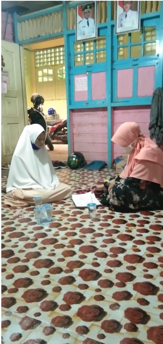
Foto wawancara dengan santri pondok pesantren Darussalam martapura