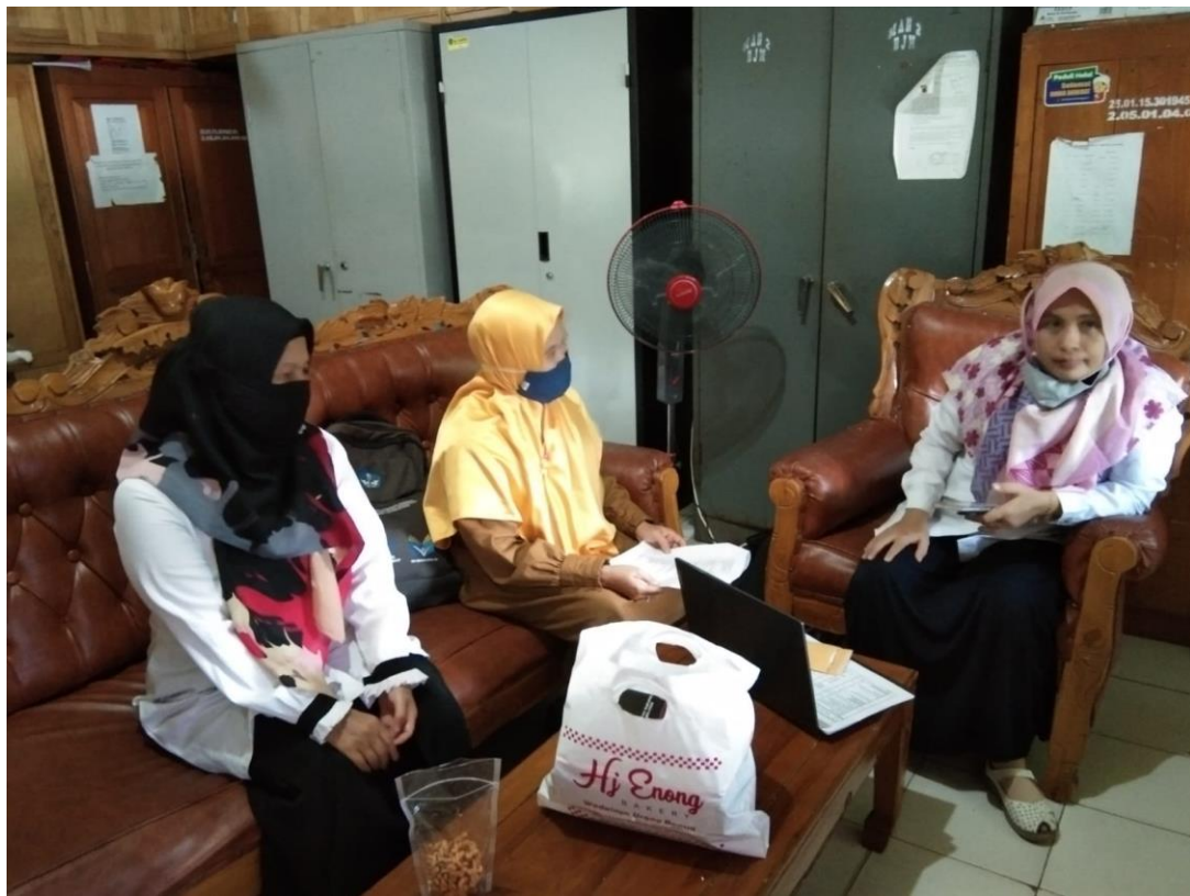
mengajukan surat ijin penelitian kepada wakil kepala Madrasah Aliyah 2 Banjrmasin