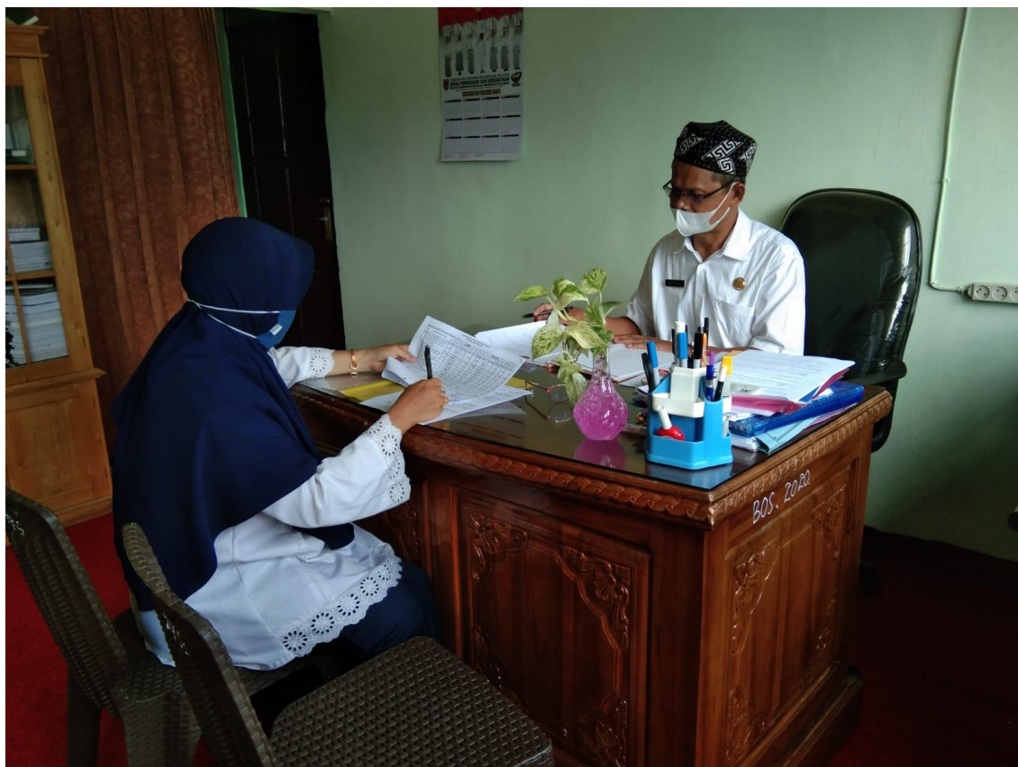
Foto kegiatan studi pendahuluan wawancara dengan Kepala sekolah SMAN 2