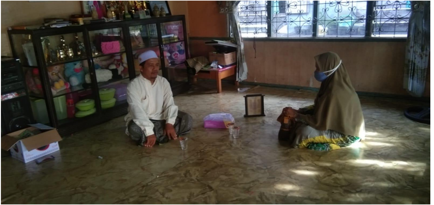
Foto wawancara dengan orangtua santri Pondok pesantren Darussalam Martapura