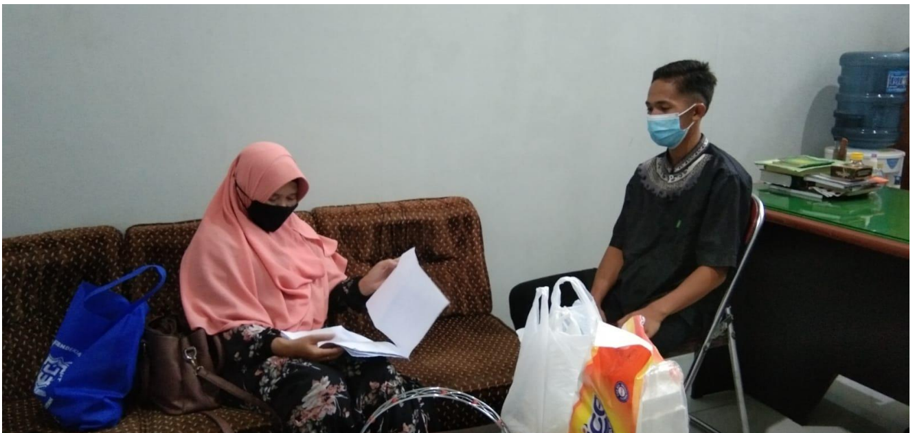
Foto wawancara dengan informan remaja pelajar SMAN 2 martapura