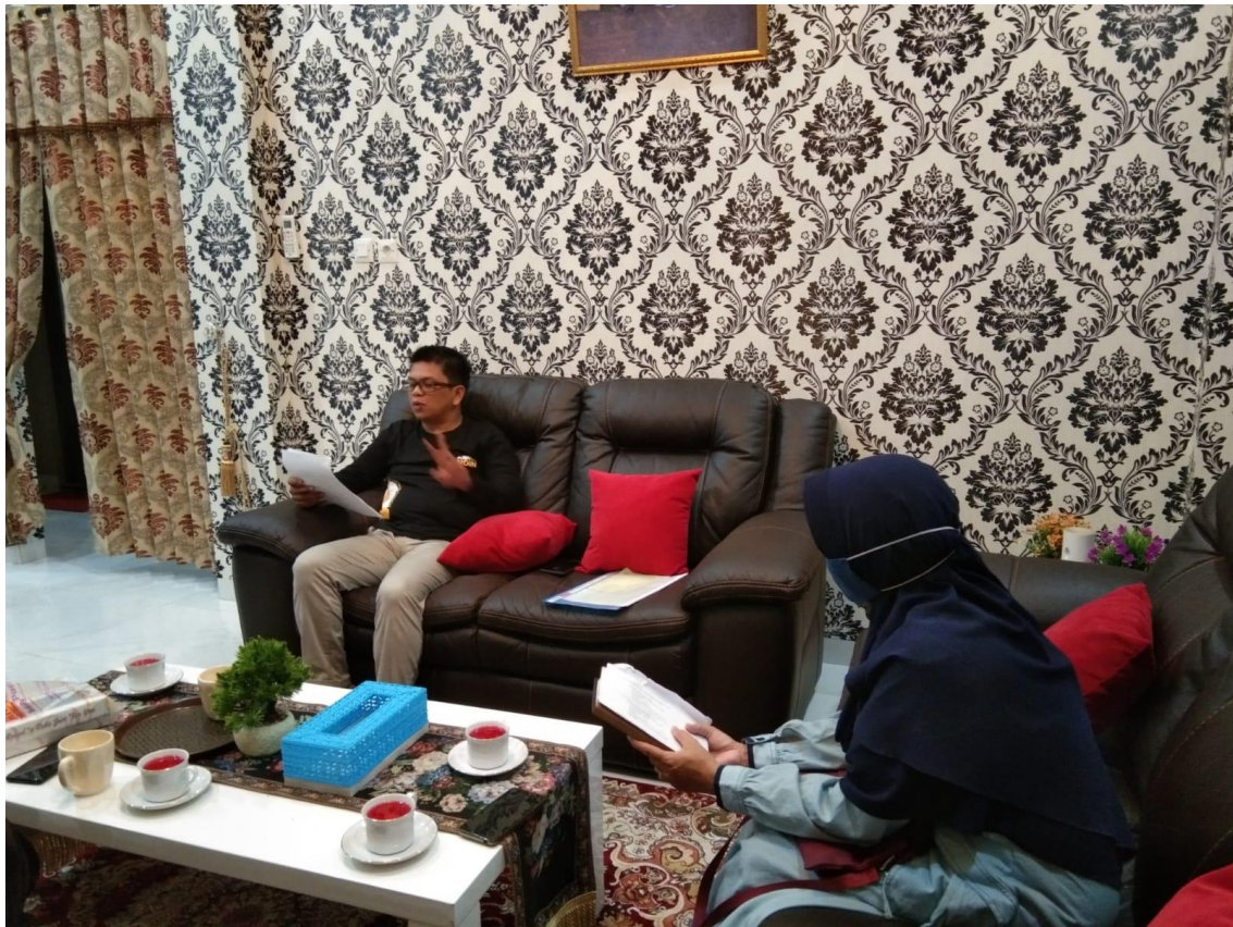
Foto kegiatan wawancara dengan tokoh masyarakat di sekitar sekolah dan pondok