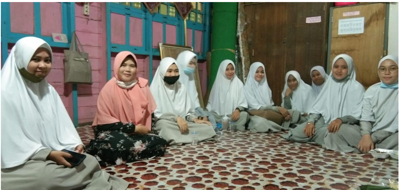
Foto bersama dengan informan santri ponpes Darussalam martapura