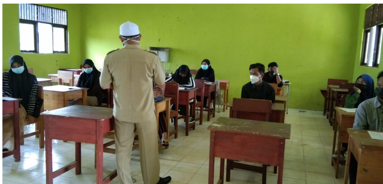
Foto kegiatan belajar tatap muka terbatas Guru PAI SMAN 2 Martapura