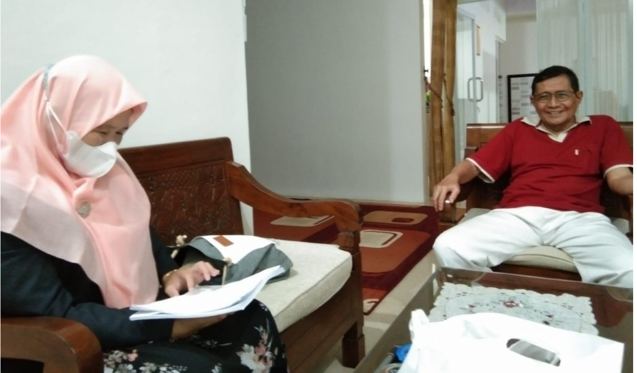
Foto proses bimbingan dengan promotor saat pengecekan keabsahan data