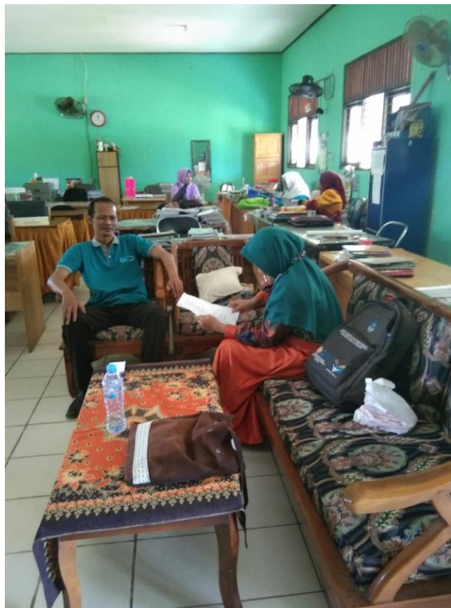
Wawancara dengan Wakil Kepala SMAN 2 Martapura seputar profil sekolah dan sistem