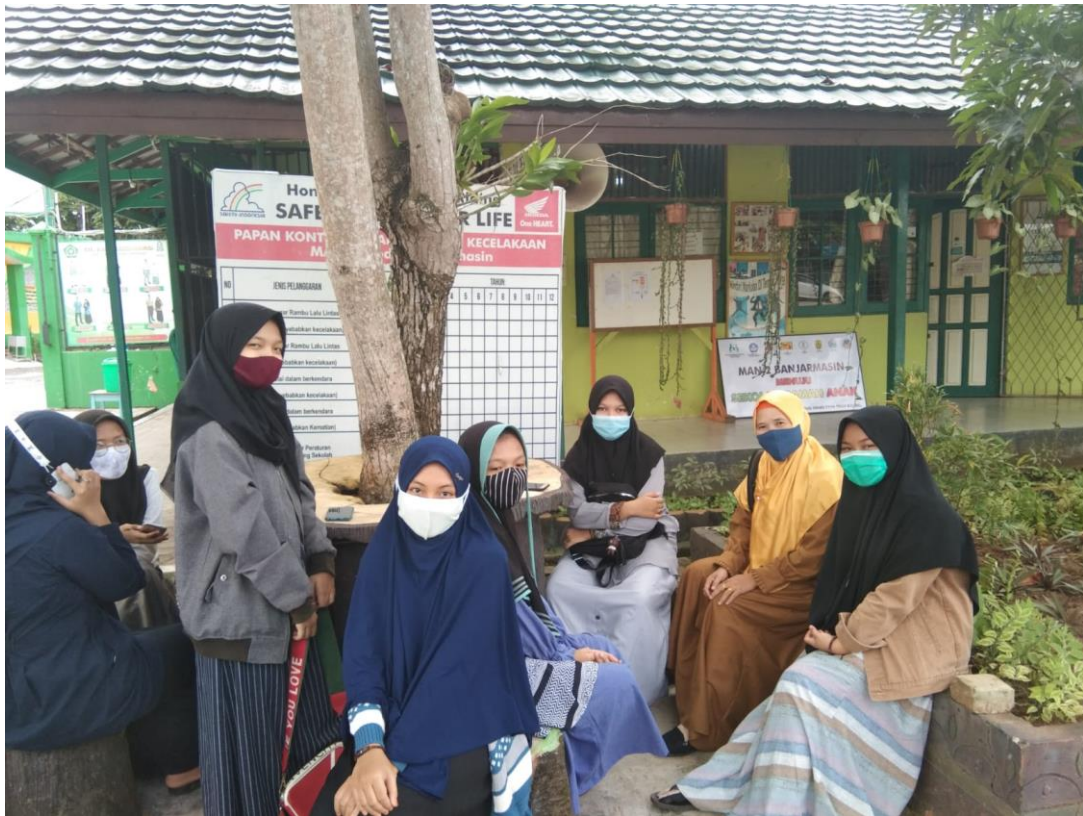
Observasi lapangan ke MAN 2 Banjarmasin, studi pendahuluan untuk pengambilan