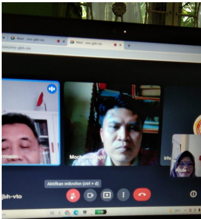
Foto kegiatan Audit trail bersama pakar ( pembimbing) dengan sesama mahasiswa