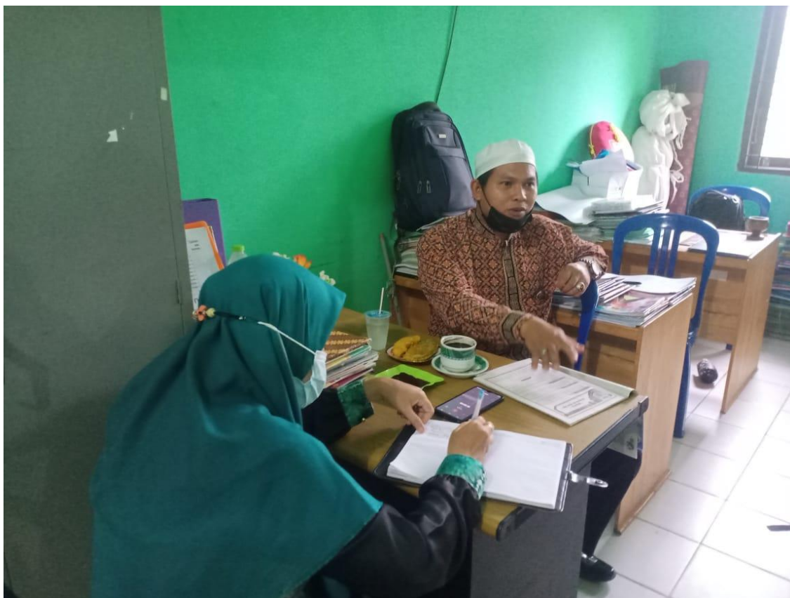
Foto kegiatan wawancara dengan Guru PAI SMAN 2 Martapur