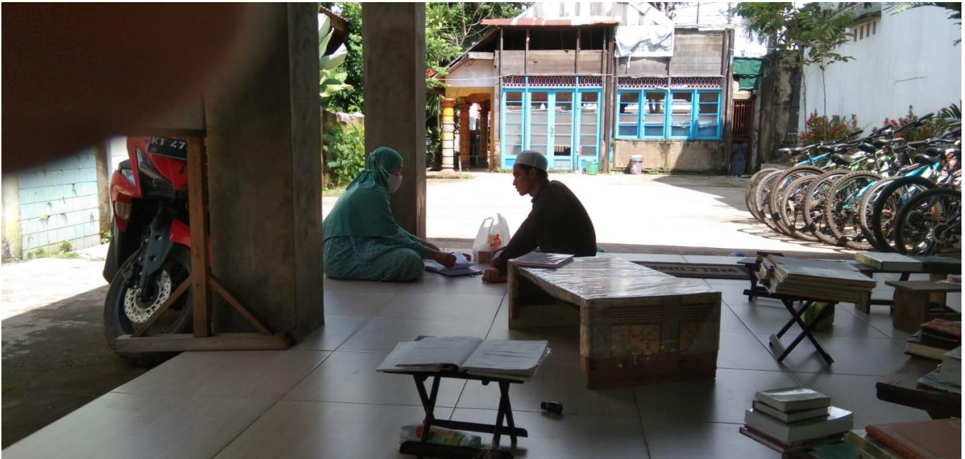
Foto kegiatan wawancara remaja santri Darussalam martapura