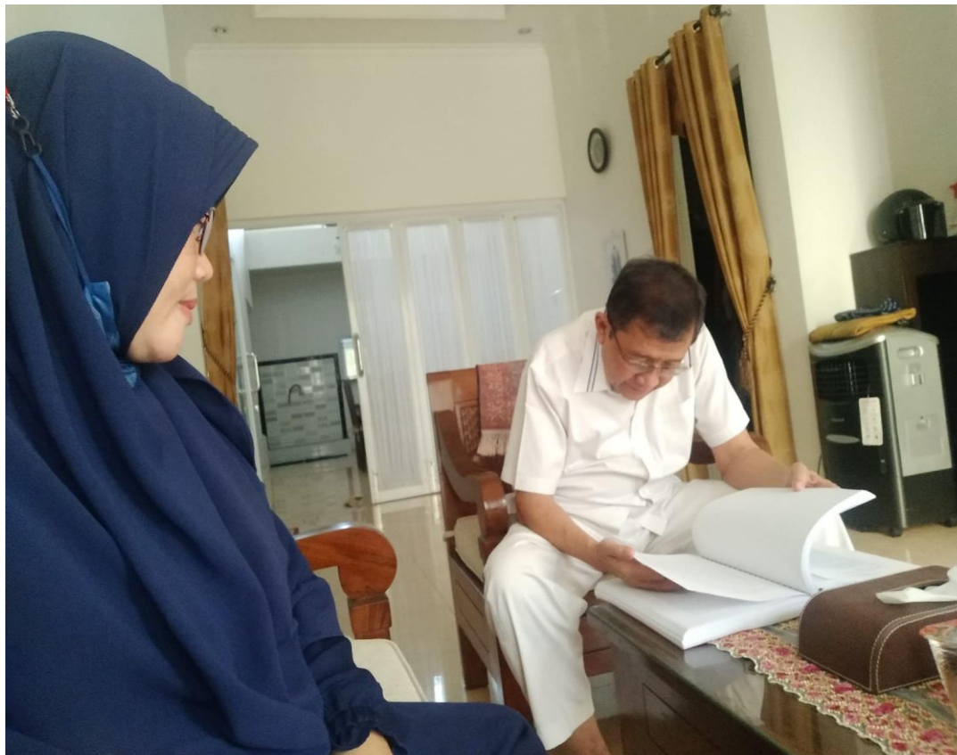
Foto kegiatan konsultasi pelaporan hasil penelitian dengan pembimbing 1