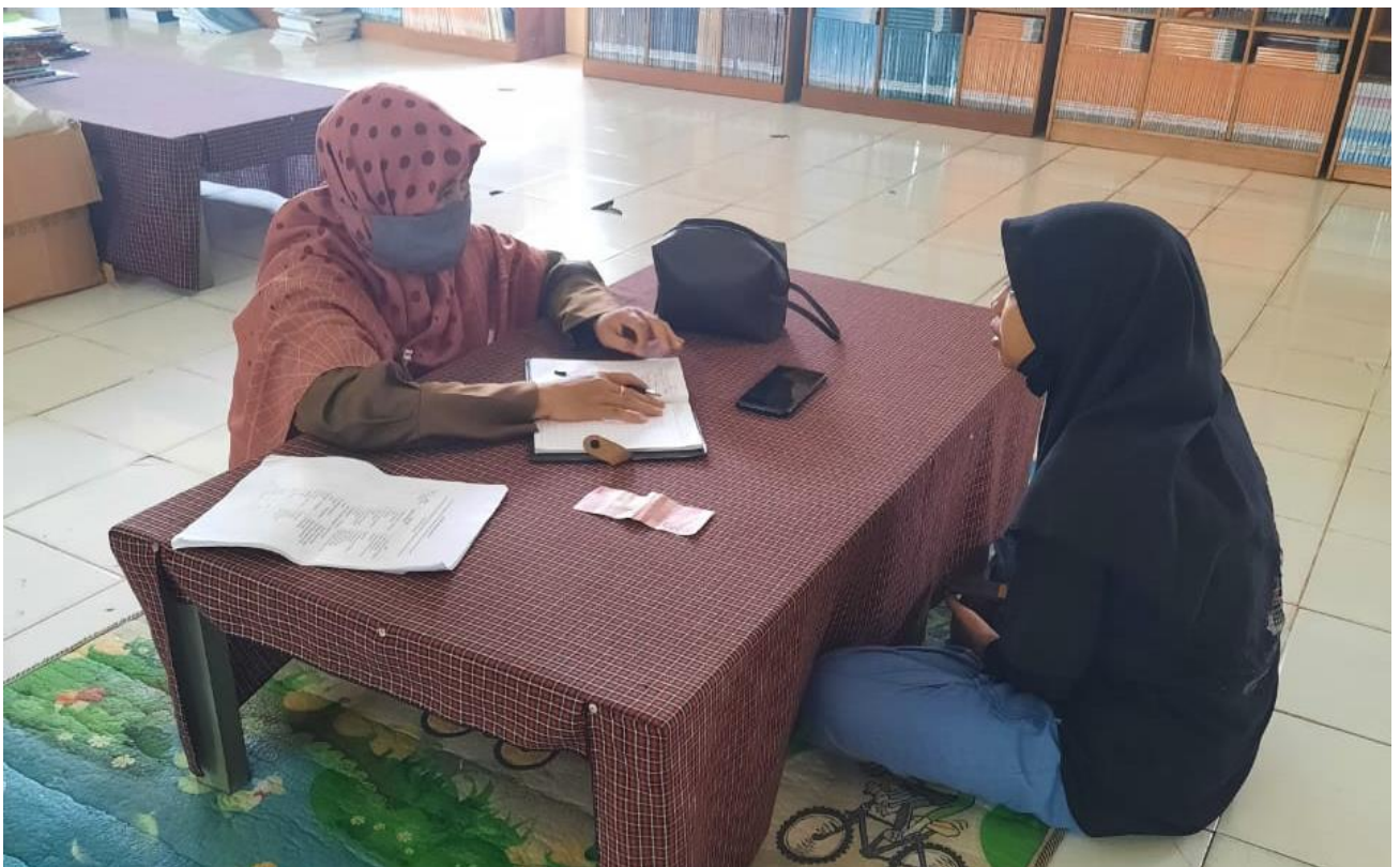
Foto kegiatan wawancara dengan remaja pelajar SMAN 2 Martapura