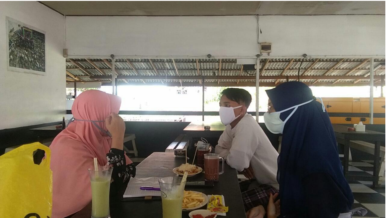
Foto kegiatan wawancara dengan remaja pelajar MAN 2 Banjarmasin