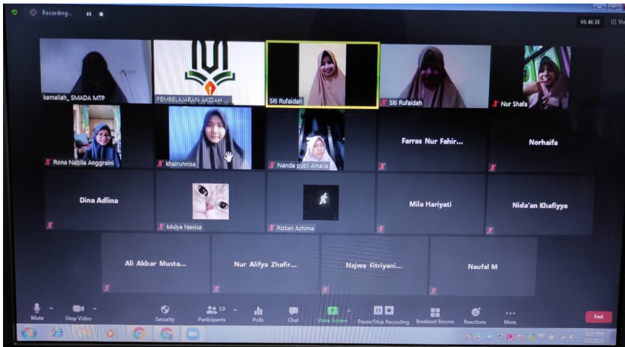
foto kegiatan observasi partisipan peneliti saat Pembelajaran daring Akidah di MAN 2