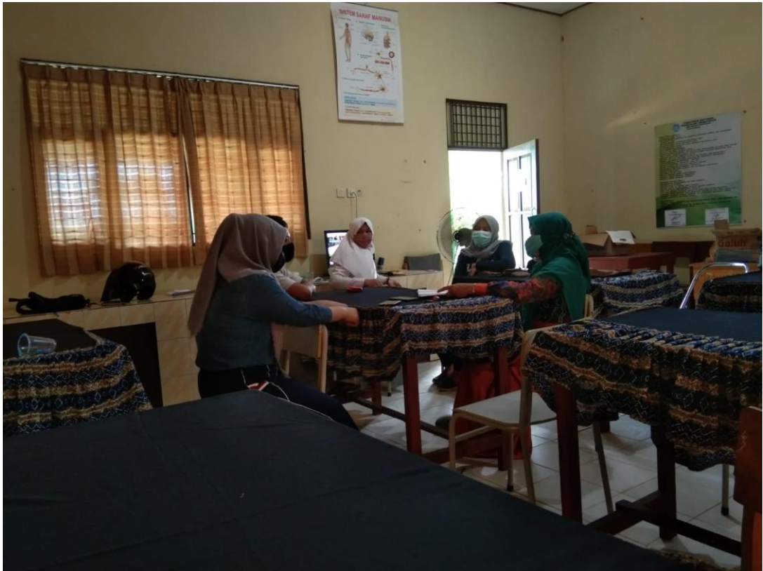
Foto wawancara dengan sejumlah siswa SMAN 2 Martapura