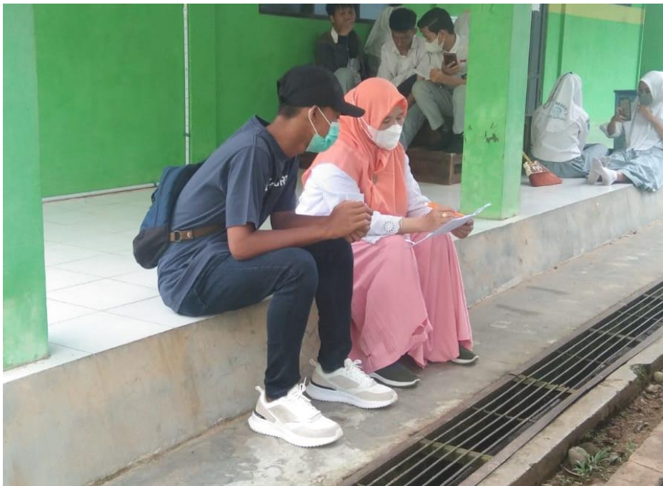
Foto kegiatan wawancara dengan remaja pelajar SMAN 2 Martapura