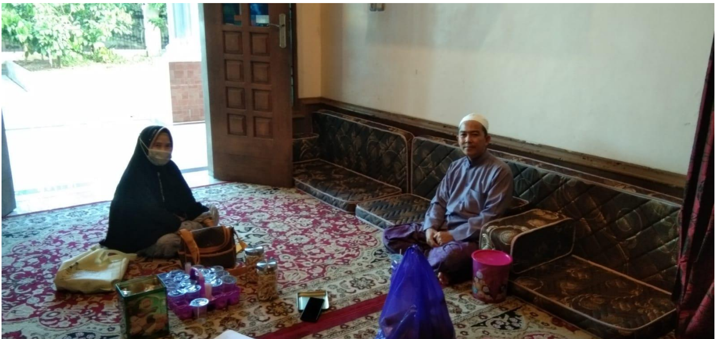
Foto kegiatan wawancara dengan tokoh masyarakat sekitar tempat tinggal santri