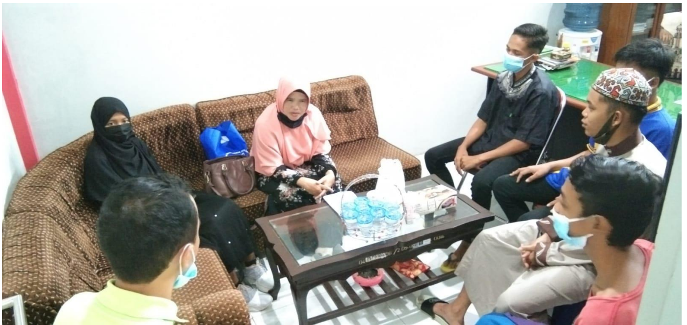
Foto kegiatan observasi kondisi Pembelajaran remaja pelajar SMA di Lapas Anak