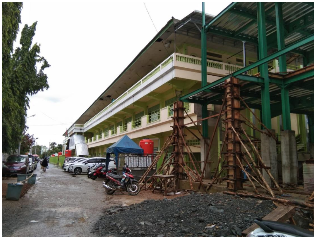
Foto suasana pondok saat santri pondok pesantren belajar