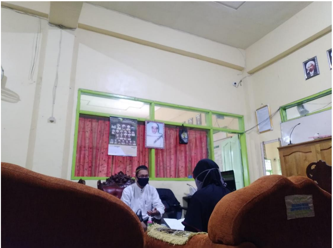
Foto wawancara dengan Sekretaris Yayasan Ponpes Darussalam Martapura