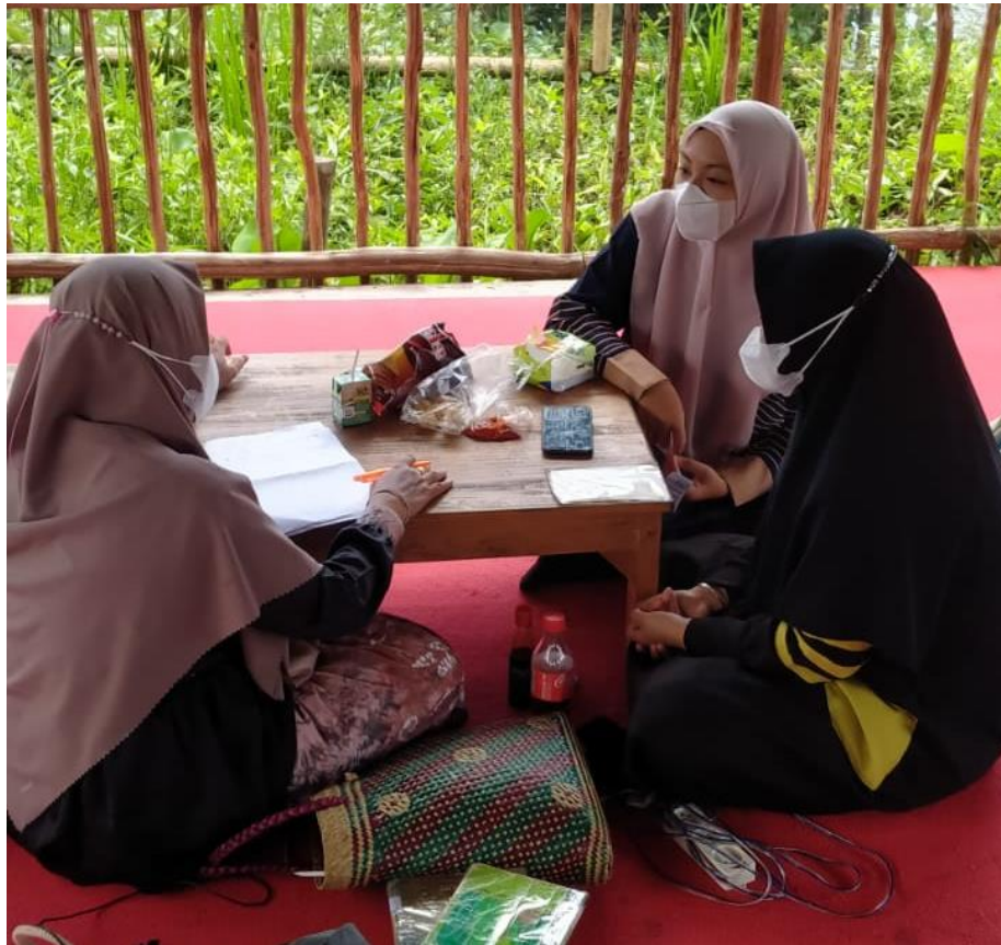
Foto kegiatan wawancara dengan remaja Pelajar MAN 2 Banjarmasin