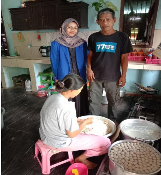
Wawancara dengan Pemilik Usaha Pentol 77