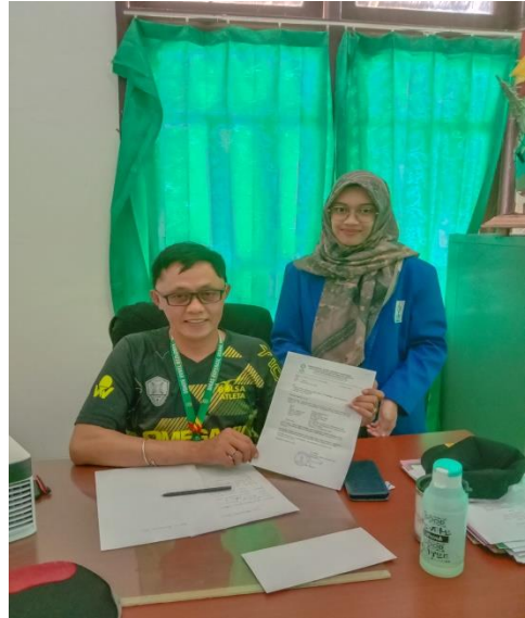
Wawancara dengan Kepala Bidang Koperasi dan Usaha Mikro