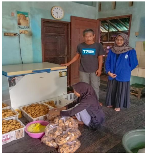
Pengemasan Tahu untuk dijual