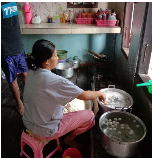
Proses Pembuatan Pentol Ikan