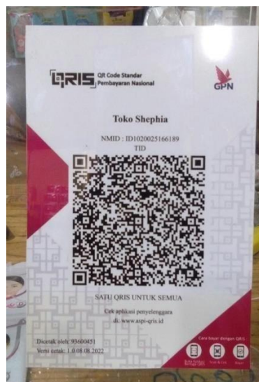
Gambar 4. 6 QRIS TOKO SHEPHIA