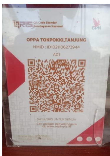
Gambar 4. 7 QRIS OPPIA TOKPOKKI TANJUNG