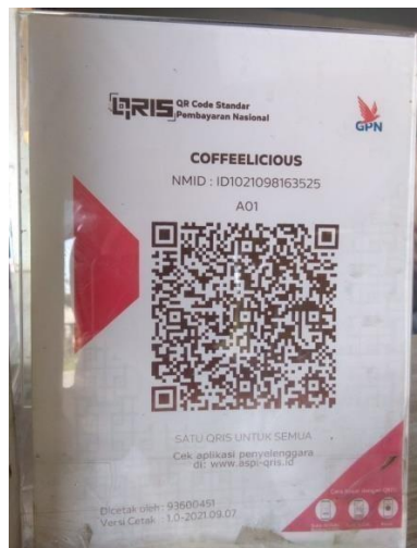
Gambar 4. 8 QRIS COFFEELICIOUS