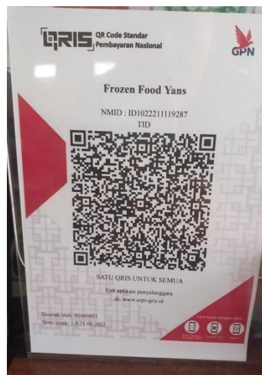
Gambar 4. 4 QRIS YANS FROZEN FOOD