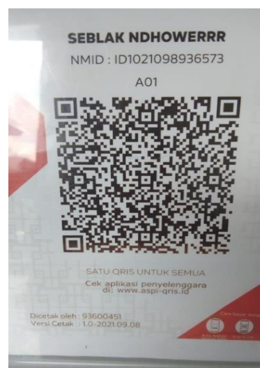
Gambar 4. 5 QRIS SEBLAK NDHOWERRR