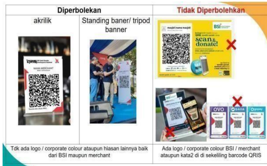
Gambar 4. 3 Ketentuan QRIS sesuai Bank Indonesia