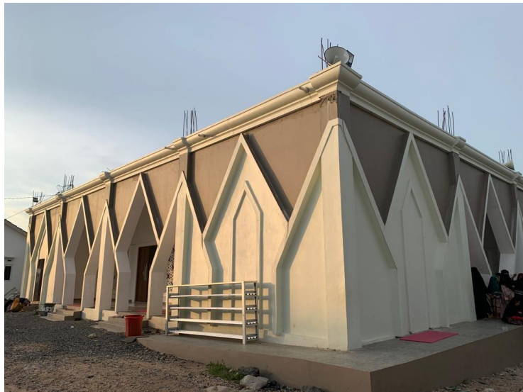
Foto Keadaan Sekitar Pondok Pesantren