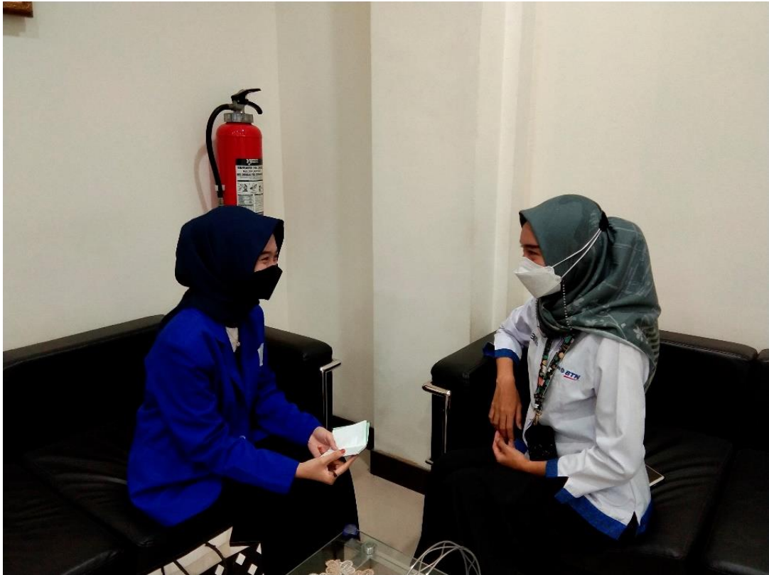
Wawancara dengan RMS sebagai Handling Customer pada PT BTN Syariah Banjarmasin, 21 September 2022.