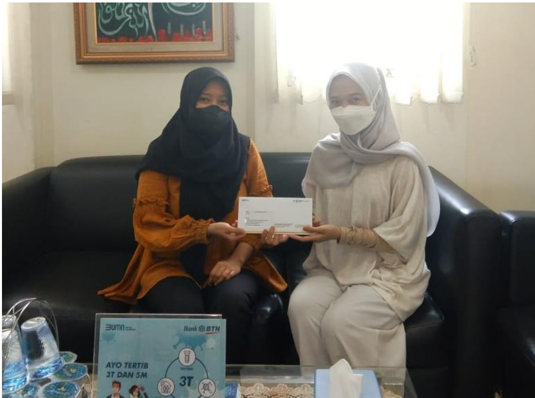
Pengambilan surat telah riset di Bank Tabungan Negara Syariah KC Banjarmasin.