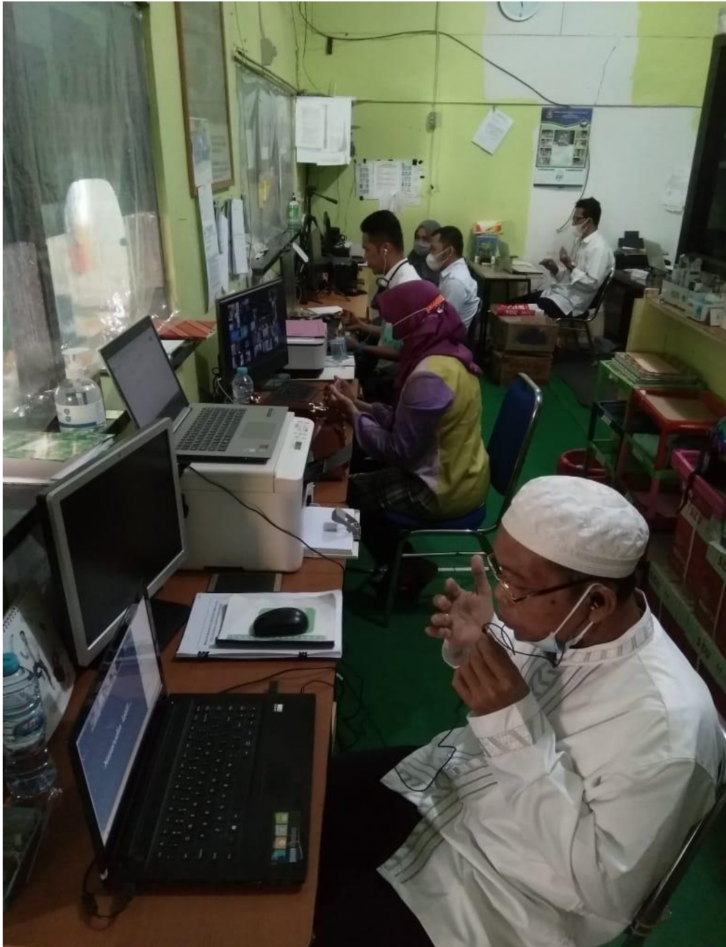
Pembacaan doa setelah pemberian materi atau bimbingan kepada calon jemaah Haji