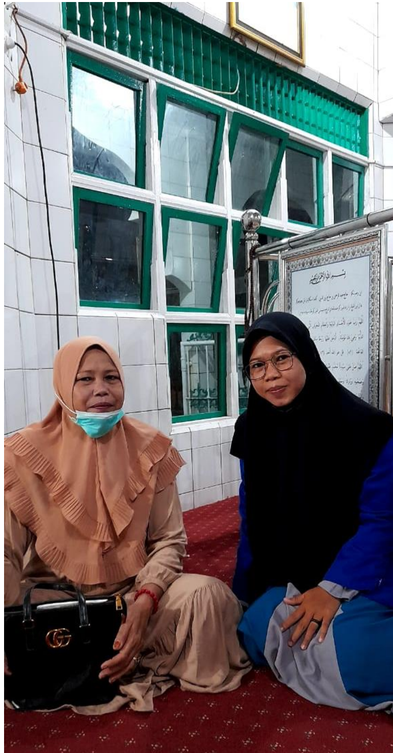
Wawancara dengan calon jemaah Haji