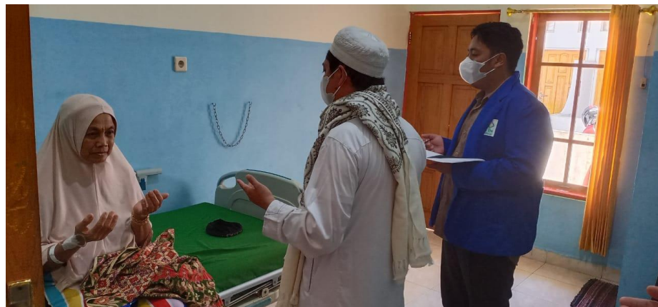
Dokumentasi pada saat bimbingan rohani Islam