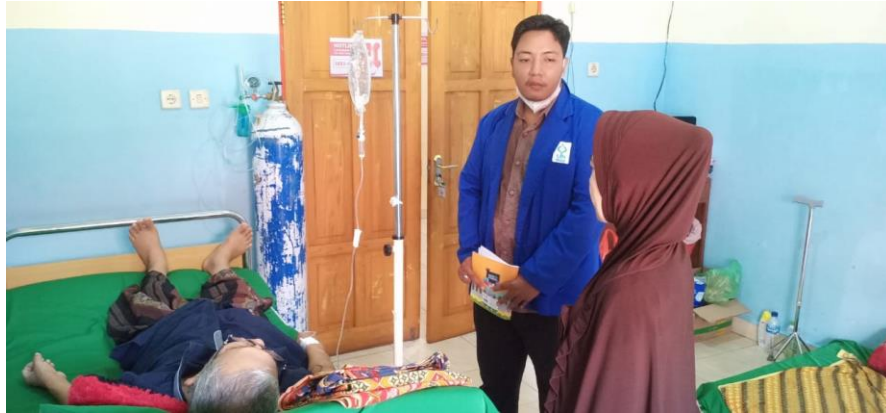
Wawancara bersama pasien setelah bimbingan