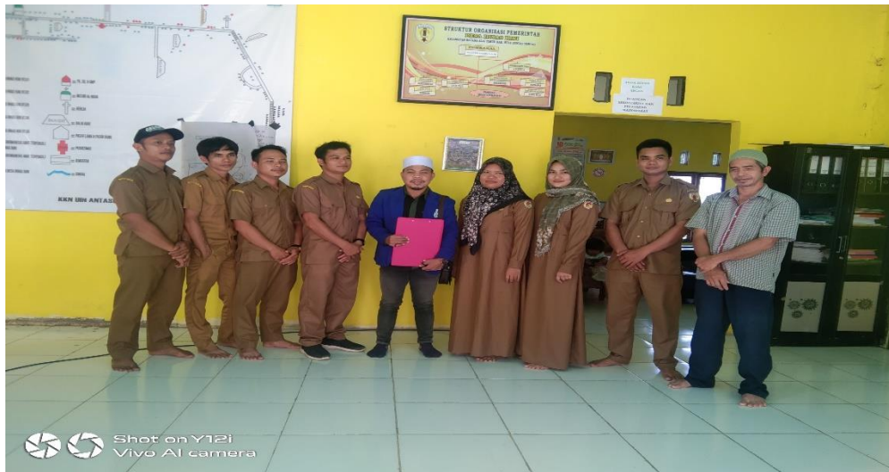
Wawancara bersama Sekdes Hinas Kiri