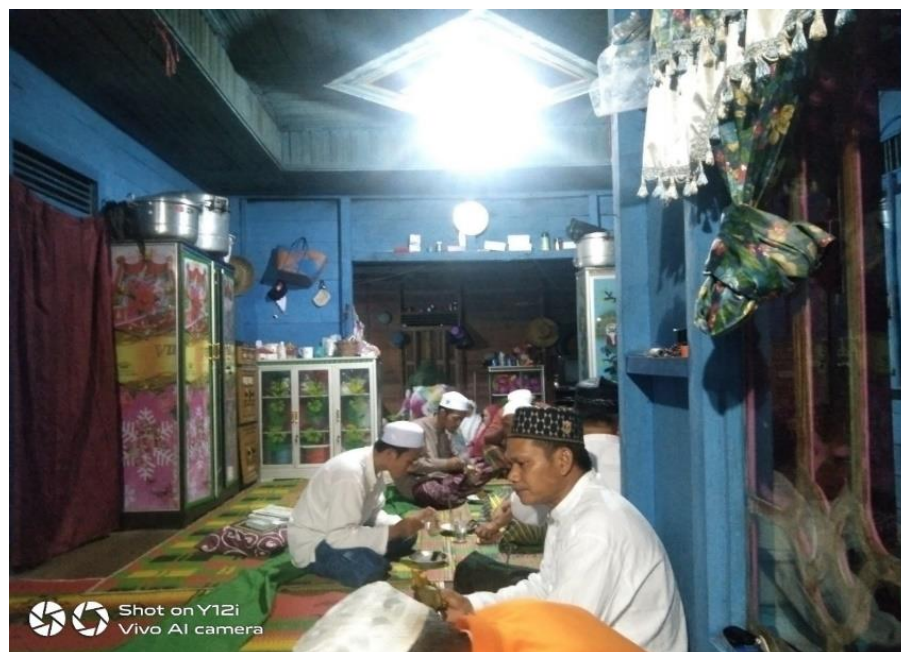
Gambar 4.2 Kegiatan Keislaman Masyarakat