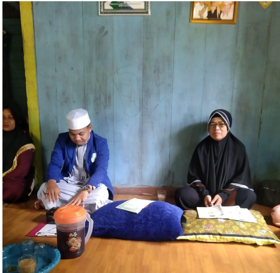
Gambar 4.7 Pengajian Agama Islam

bentuk bimbingan antara lain adalah akidah, ibadah, akhlak dari bentuk bimbingan Agama Islam terhadap masyarakat Desa Hinas Kiri.