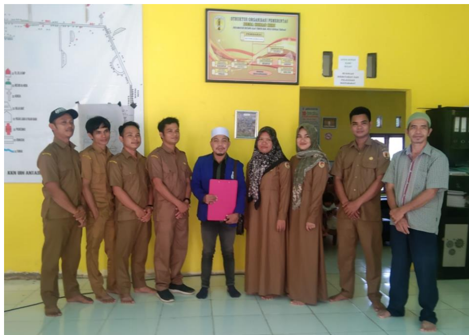
Gambar 4.4 Bersama Struktur Bimbingan Agama Islam Desa Hinas Kiri