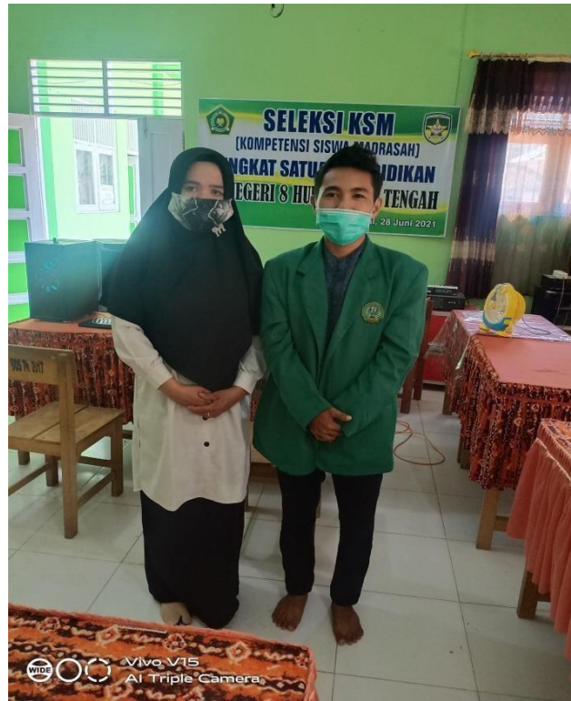
FOTO WAWANCARA BERSAMA GURU MIN 8 HST