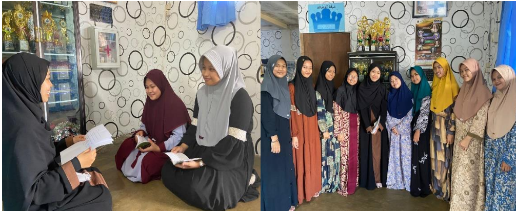
Wawancara dan foto bersama dengan santriwati asrama tahfiz