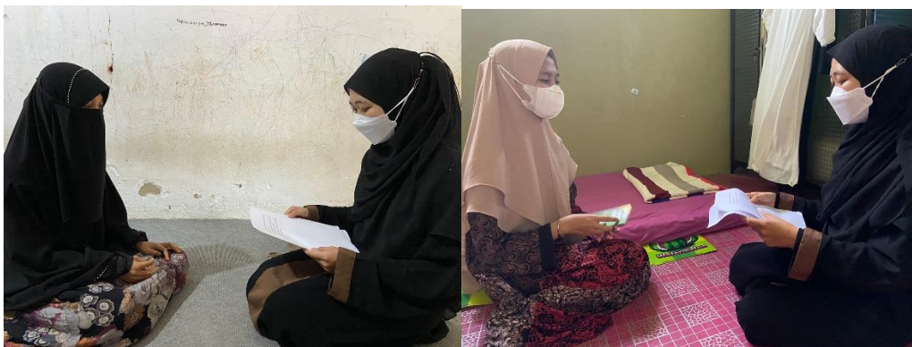
Wawancara dengan ustadzah dan musyrifah asrama tahfiz