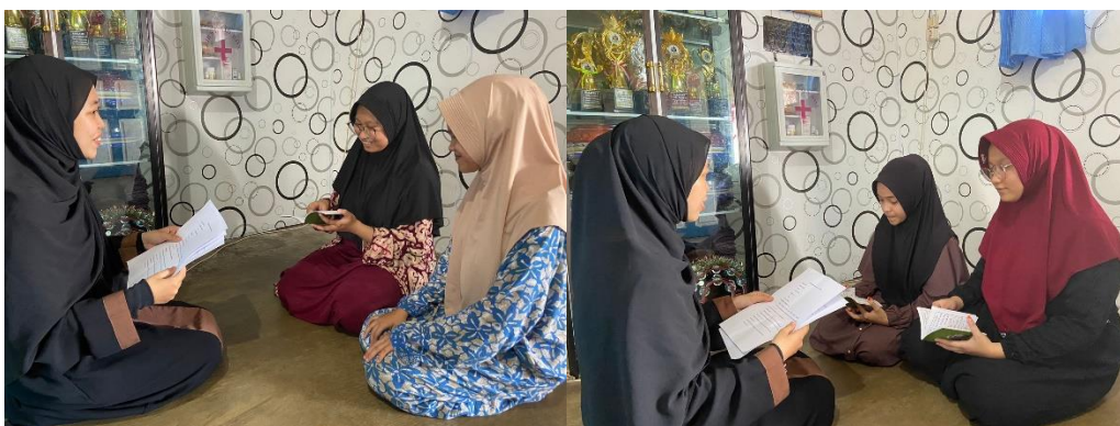
Wawancara dengan santriwati asrama tahfiz