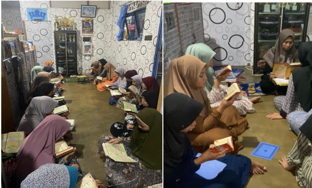
Santriwati ketika halaqah setoran dan pembacaan Hizib al Daur al-A'la