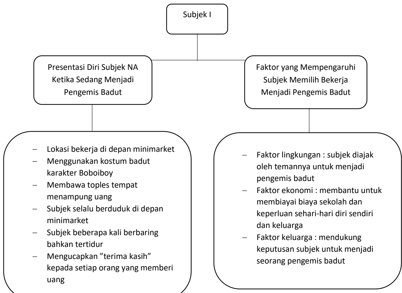
Bagan 4. 2 Ringkasan Data Hasil Penelitian Subjek I

menjadi seorang pengemis badut secara tetap karena mendapatkan uang yang dimana sesuai pengakuannya digunakan untuk memenuhi kebutuhan sekolahnya seperti uang jajan sehari-harinya, untuk ditabung, dan sebagian diberikan kepada orang tuanya. Kemudian subjek I menjelaskan orang tuanya juga tidak melarang dirinya untuk bekerja menjadi seorang pengemis badut, subjek I menyebutkan bahwa orang tuanya mengizinkan asalkan subjek I tidak merasa terbebani sehingga subjek I sampai saat ini tetap menjalankan profesinya sebagai seorang pengemis badut.