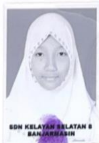
SDN KELAYAN SELATAN 8 BANJARMASIN

dari satuan pendidikan berdasarkan hasil Ujian Nasional dan Ujian Sekolah serta telah memenuhi seluruh kriteria sesuai dengan peraturan perundang-undangan.