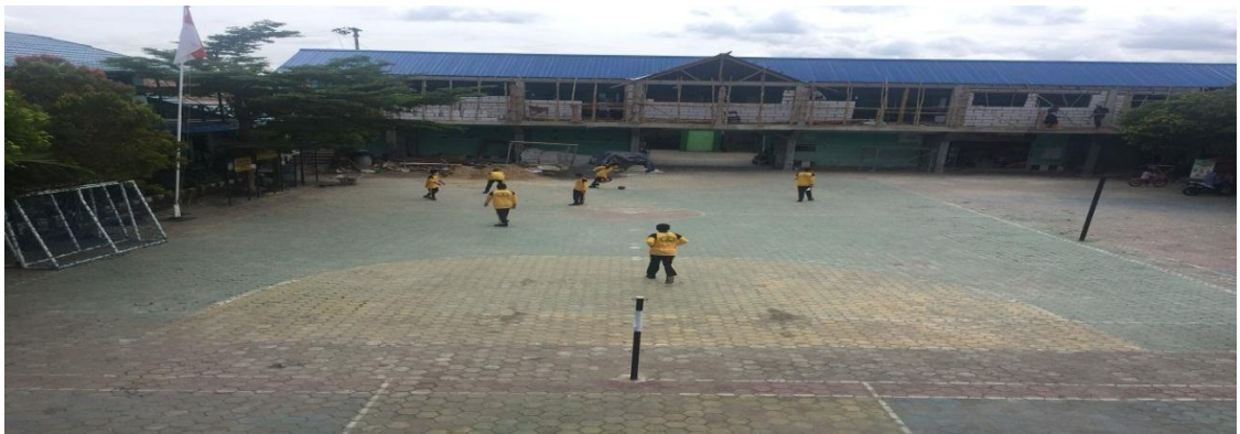
Lapangan MTs Muhammadiyah 3 Al-Furqan Banjarmasin