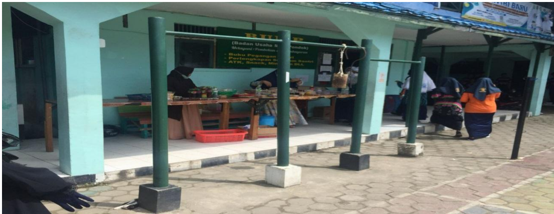
Kantin MTs Muhammadiyah 3 Al-Furqan Banjarmasin