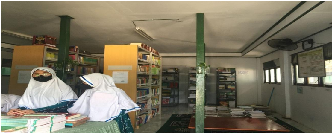
Perpustakaan MTs Muhammadiyah 3 Al-Furqan Banjarmasin