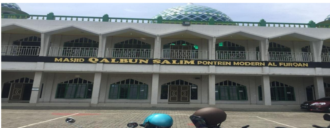
Masjid MTs Muhammadiyah 3 Al-Furqan Banjarmasin