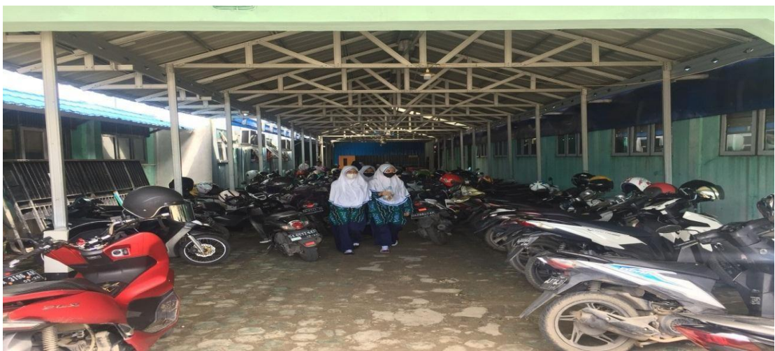
Parkiran MTs Muhammadiyah 3 Al-Furqan Banjarmasin