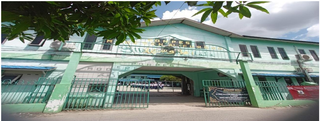
MTs Muhammadiyah 3 Al-Furqan Banjarmasin