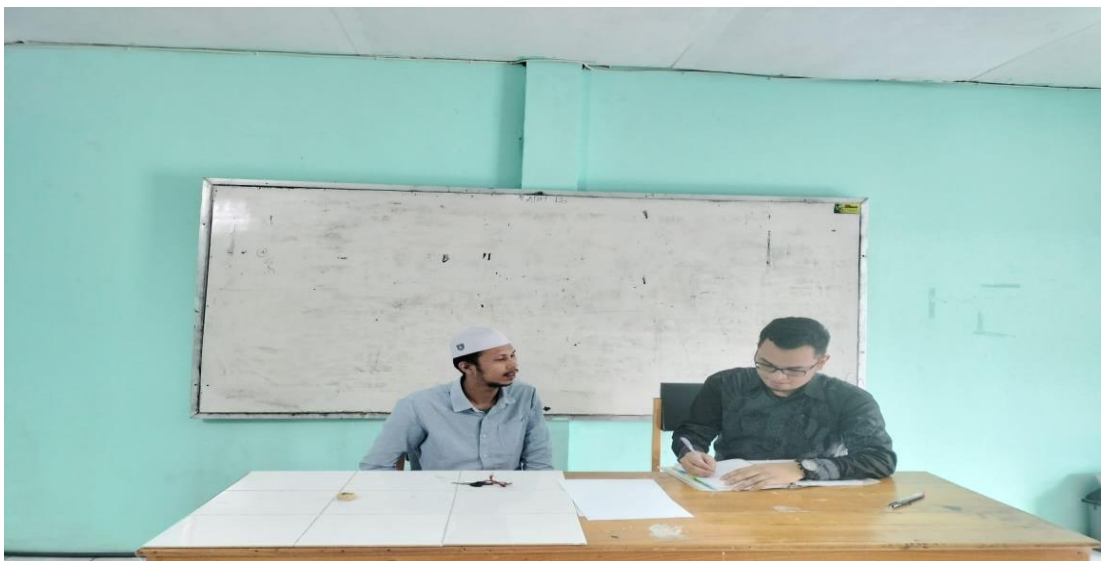
Wawancara dengan Guru SKI MTs Muhammadiyah 3 Al-Furqan Banjarmasin