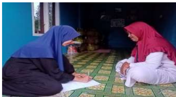
Gambar 5.3 Wawancara bersama Ibu NM selaku Orang Tua Desa Sungai Cabang Barat RT 9.