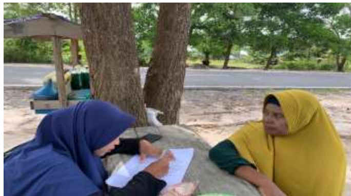
Gambar 5.11 Wawancara bersama Ibu Y selaku Orang Tua Desa Sungai Cabang Barat