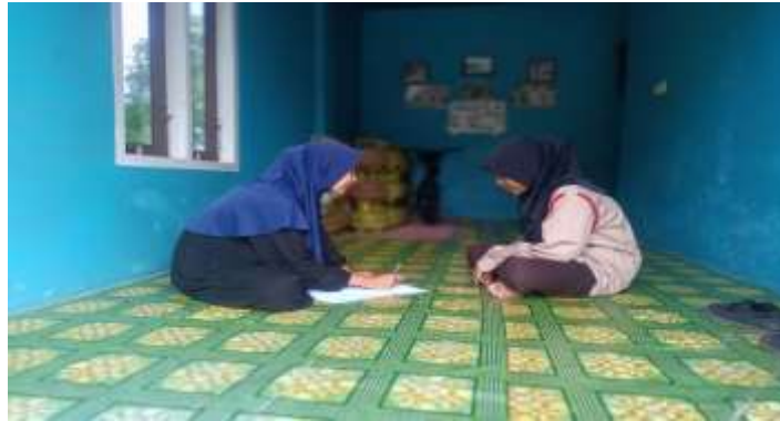
Gambar 5.13 Wawancara bersama KK (Remaja Putri Desa Sungai Cabang Barat RT 9)