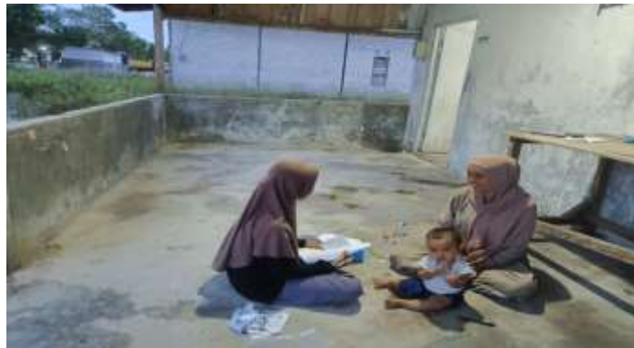
Gambar 5.24 Wawancara bersama Ibu SS selaku Tetangga dan Keluarga Orang Tua Sungai Cabang Barat