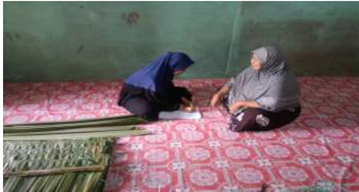
Gambar 5.10 Wawancara bersama Ibu SM selaku Orang Tua Desa Sungai Cabang Barat RT 10