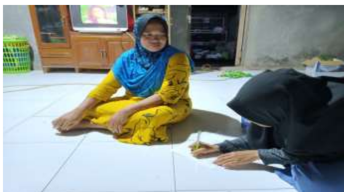
Gambar 5.9 Wawancara bersama Ibu NS selaku Orang Tua Desa Sungai Cabang Barat RT 10