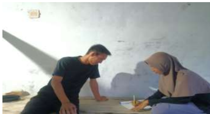
Gambar 5.21 Wawancara bersama NU selaku Tetangga dan Keluarga Orang Tua Sungai Cabang Barat