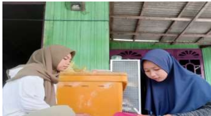
Gambar 5.17 Wawancara bersama SF (Remaja Putri Desa Sungai Cabang Barat RT 10)