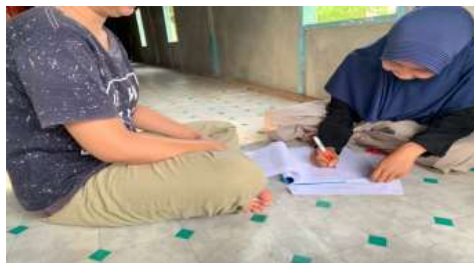
Gambar 5.15 Wawancara bersama DWP (Remaja Putri Desa Sungai Cabang Barat RT 9)