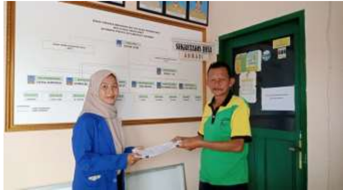
Gambar 5.1 Penyerahan Dokumen Profil Desa Sungai Cabang Barat