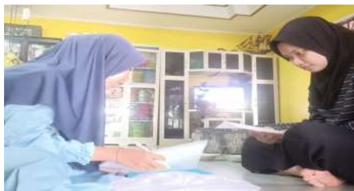
Gambar 5.12 Wawancara bersama BD (Remaja Putri Desa Sungai Cabang Barat RT 9)