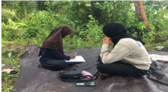
Gambar 5.16 Wawancara bersama SL (Remaja Putri Desa Sungai Cabang Barat RT 9)