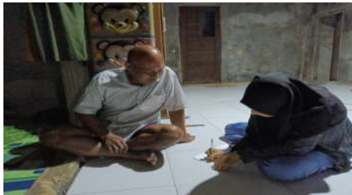
Gambar 5.5 Wawancara bersama Bapak G selaku Orang Tua Desa Sungai Cabang Barat RT 10