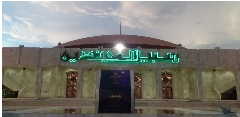
Picture 1 The front of Sabial Muhtadin Great Mosque