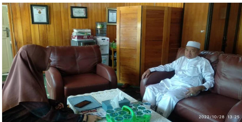
Picture 3 Interview with the chairman manager of the Great Mosque Sabial Muhtadin