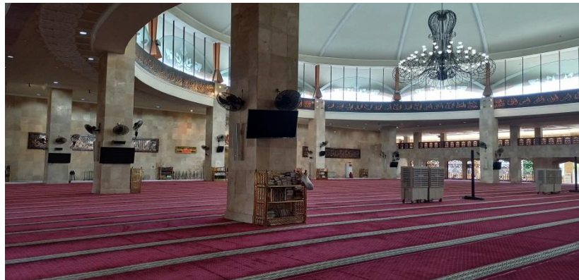
Picture 2 Main hall of Sabial Muhtadin Great Mosque