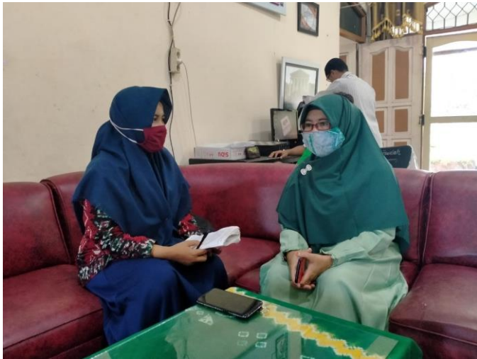
Wawancara dengan Guru PAI SMP Islam Sabilal