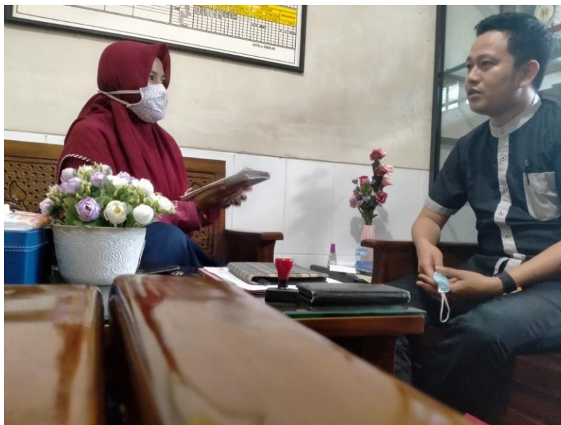
Kepala Sekolah SMP Plus Citra Madinatul Ilmi Banjarbaru