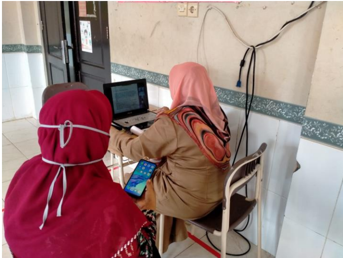
Pembelajaran Online di SMP Plus Citra Madinatul Ilmi Banjarbaru