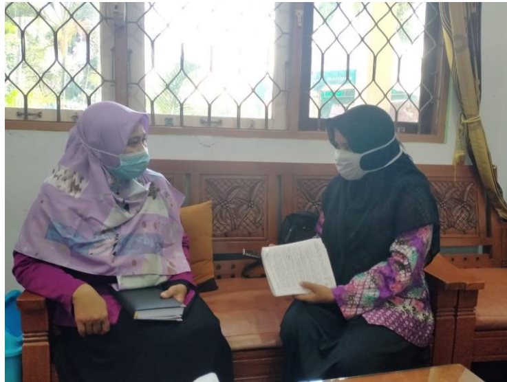
Kepala Sekolah SMP Islam Sabial Muhtadin Banjarmasin