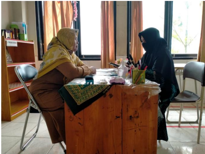
Wawancara dengan Guru SMP Plus Citra Madinatul Ilmi Banjarbaru