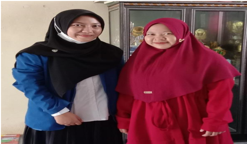
(Wawancara dengan Ustadzah Pengajar Pondok Pesantren)