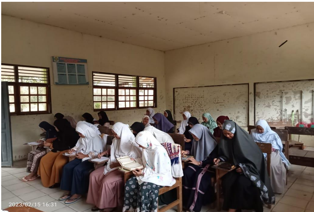
(Pembelajaran Kitab santri putri)