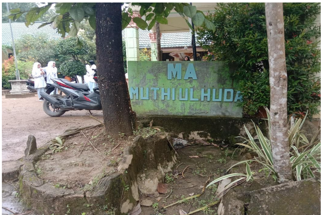
(Ruang Guru MA)