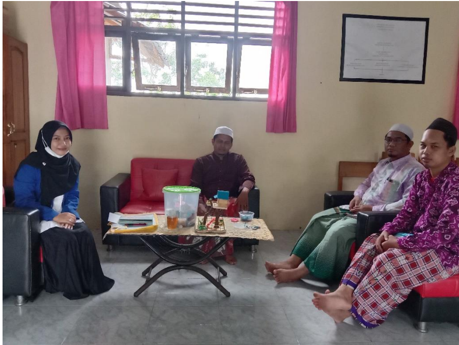
(Wawancara dengan Ustadz pengajar pondok pesantren)