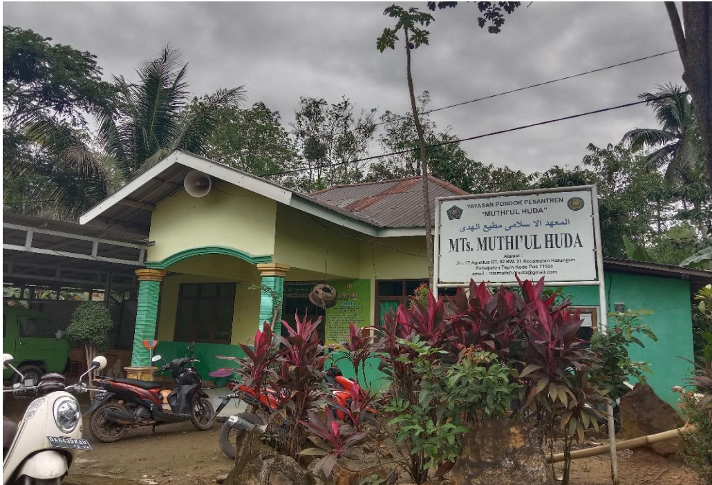
(Ruang Guru Mts)