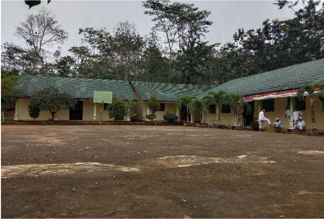
(Ruang kelas )