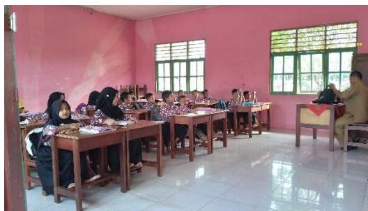
Siswa berdoa sebelum belajar