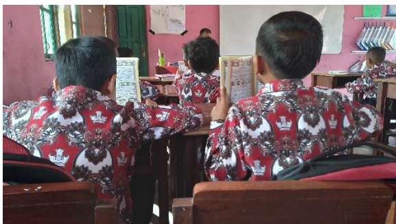
Siswa membaca Surah-Surah Pendek sebelum belajar