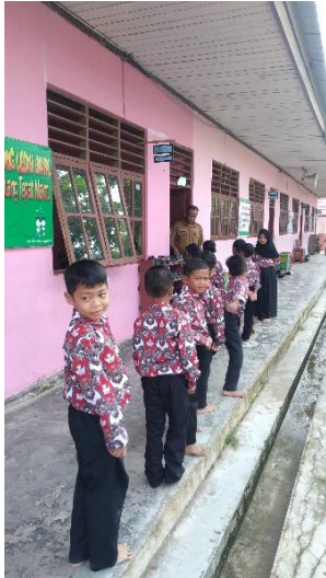
Siswa berbaris sebelum masuk kelas