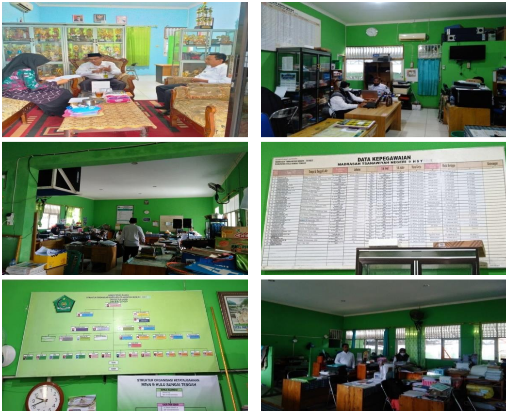
foto kepala madrasah bersama dewan guru dan staf, 4 kalender, 1 wifi, dan di dalam ruang guru juga terdapat dapur serta peralatan memasak. Di dalam ruang tata usaha terdapat 6 meja dan kursi kerja, 1 televisi, 1 AC pendingin udara, 2 printer dan 3 komputer, 3 lemari yang digunakan untuk menyimpan berkas penting dan perlengkapan lainnya untuk madrasah, 1 foto bersama kepala madrasah dengan dewan guru serta staf, 2 jam dinding, 2 kalender, 1 tempat sampah kecil, 1 papan data kepegawaian dan daftar wali kelas, struktur organisasi MTsN 9 HST dan struktur organisasi ketatausahaan.