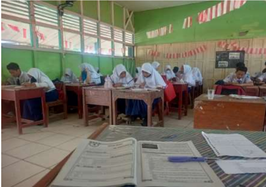
Gambar 1. Kegiatan siswa Saat Menjawab Soal Pre Test