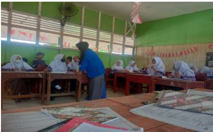
Gambar 2. Kegiatan Penerapan Model Experiential Learning