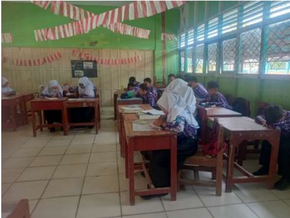
Gambar 3. Kegiatan Saat Mengerjakan Soal Post Test