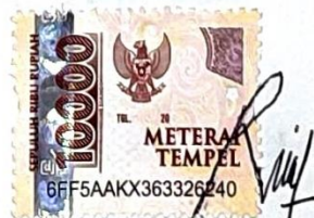
Rita Octari Dewi